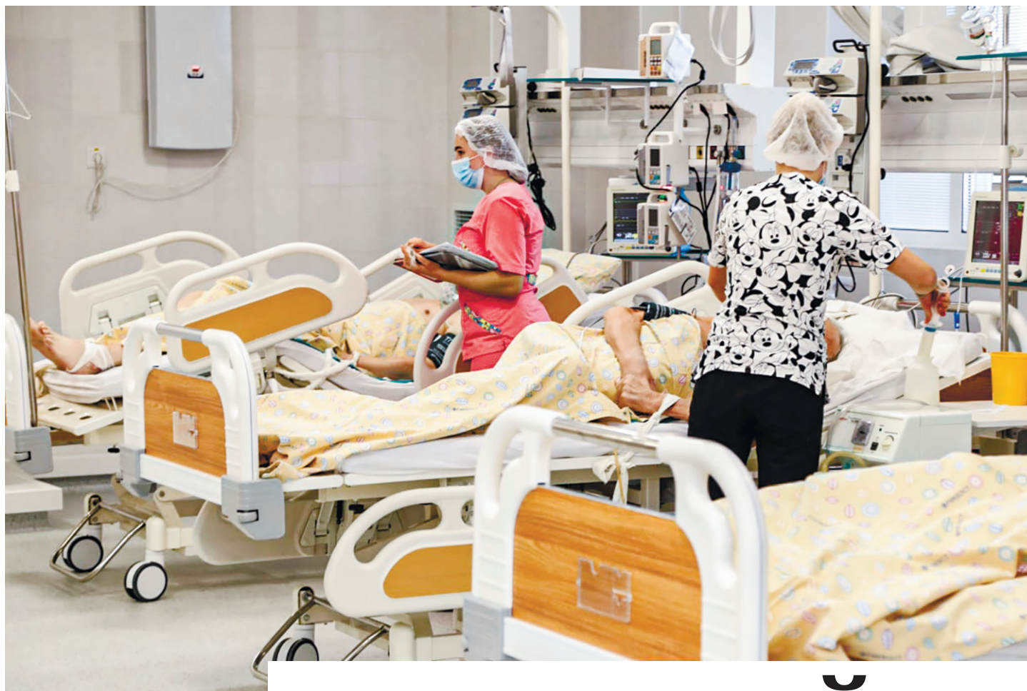
В соцсети можно предложить, как сделать работу медучреждений более эффективной. А может, и сказать медикам спасибо.

Стивен СИГАЛ, специальный представитель МИД РФ по гуманитарным связям России и США.