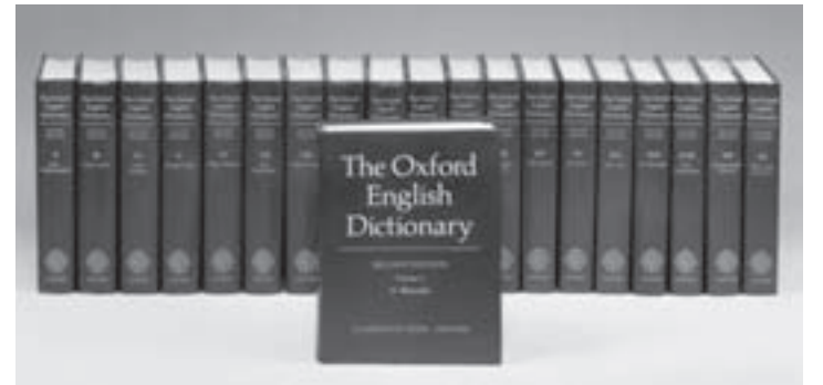
Большой Оксфордский словарь, крупнейший словарь английского языка, содержит около 500 тыс. слов и около 2 млн цитат из 20 тыс. произведений более чем 5 тыс. авторов.

Кроме «постправды» за звание слова года боролись «брекситер» ( brexiteer ) — сторонник выхода из ЕС; «хюгге»