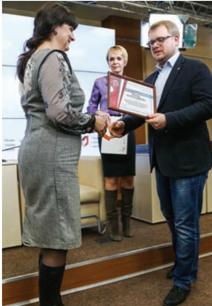
Сотрудников МФЦ поздравлял вице-премьер, министр внутренней политики, информации и связи РК Дмитрий Полонский.

Госбюджетное учреждение Республики Крым МФЦ празднует вторую годовщину создания