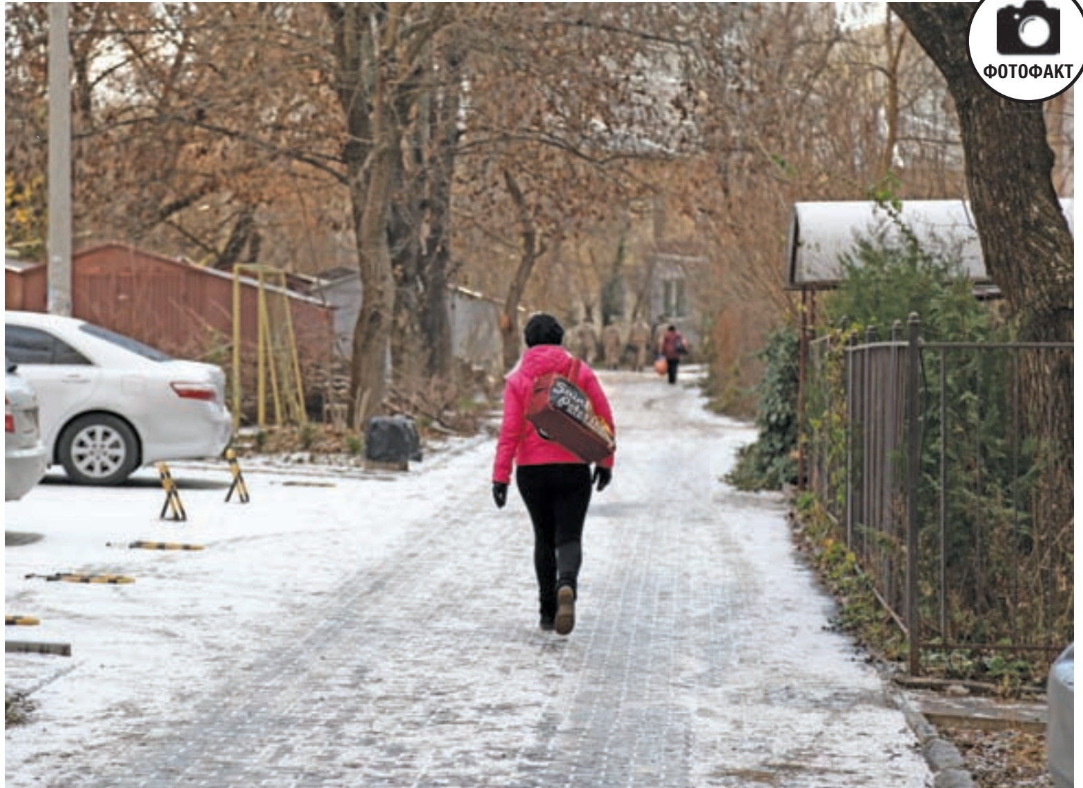
2 декабря. Симферополь. Зима пришла по календарю.

Авторы опубликованных материалов несут ответственность за точность приведённых фактов, цитат, экономических, социологических и других данных, собственных имён, географических названий. Редакция в переписку с читателями не вступает. При перепечатке материалов ссылка на «Крымскую газету» обязательна. Точка зрения авторов публикуемых материалов может не совпадать с позицией редакции. Рукописи не рецензируются и не возвращаются. За содержание рекламных материалов редакция ответственности не несёт. «Хороший пример», «знаковое событие», «» – материалы публикуются на коммерческой основе.