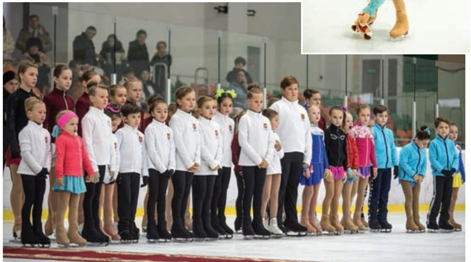
Юные фигуристы спешат выйти на лёд.

Стартовал первый Кубок Главы РК по фигурному катанию