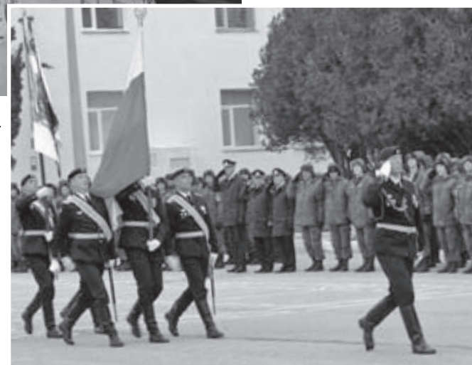
Торжественное начало учебного года: вынос боевого знамени.

Чёрные береты вошли в новый учебный год с хорошим настроением. Буквально накануне они отпраздновали День морской пехоты. Лучших наградили. Четверо военнослужащих получили ордера на новые квартиры. В их числе заместитель командира отдельной бригады морской пехоты подполков-