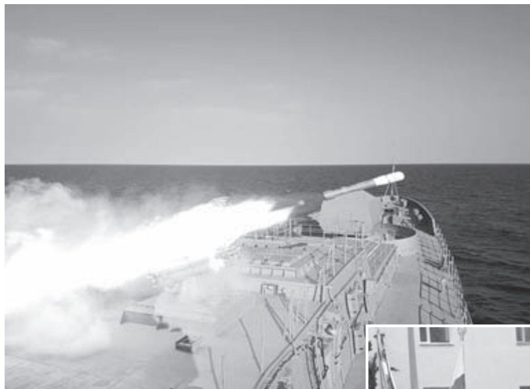
Учения: ракета-бомба сошла.

Такие награды получили в начале учебного года черноморцы