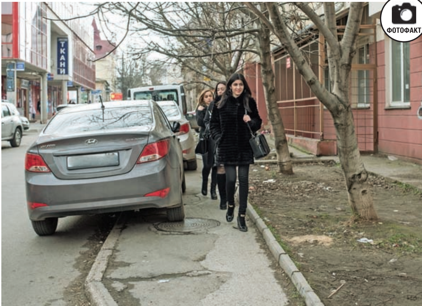
Симферополь, ул. Октябрьская. И тротуары уже заняты машинами. Пешеходам скоро придётся летать.

Оформить подписку можно в любом отделении связи КРЫМА