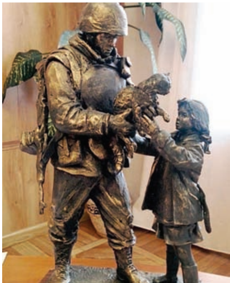
Макет будущего памятника «вежливым людям» в Симферополе.

Чем дальше уходит март 2014 года, тем больше желание увековечить память о российской армии, вставшей на защиту Крыма, сохранение территориальной целостности и восстановление исторической справедливости. Благодаря профессиональной работе «вежливых людей» в феврале-марте 2014 года на улицах крымских городов сохранился порядок. Для крымчан они стали гарантом мира и стабильности.