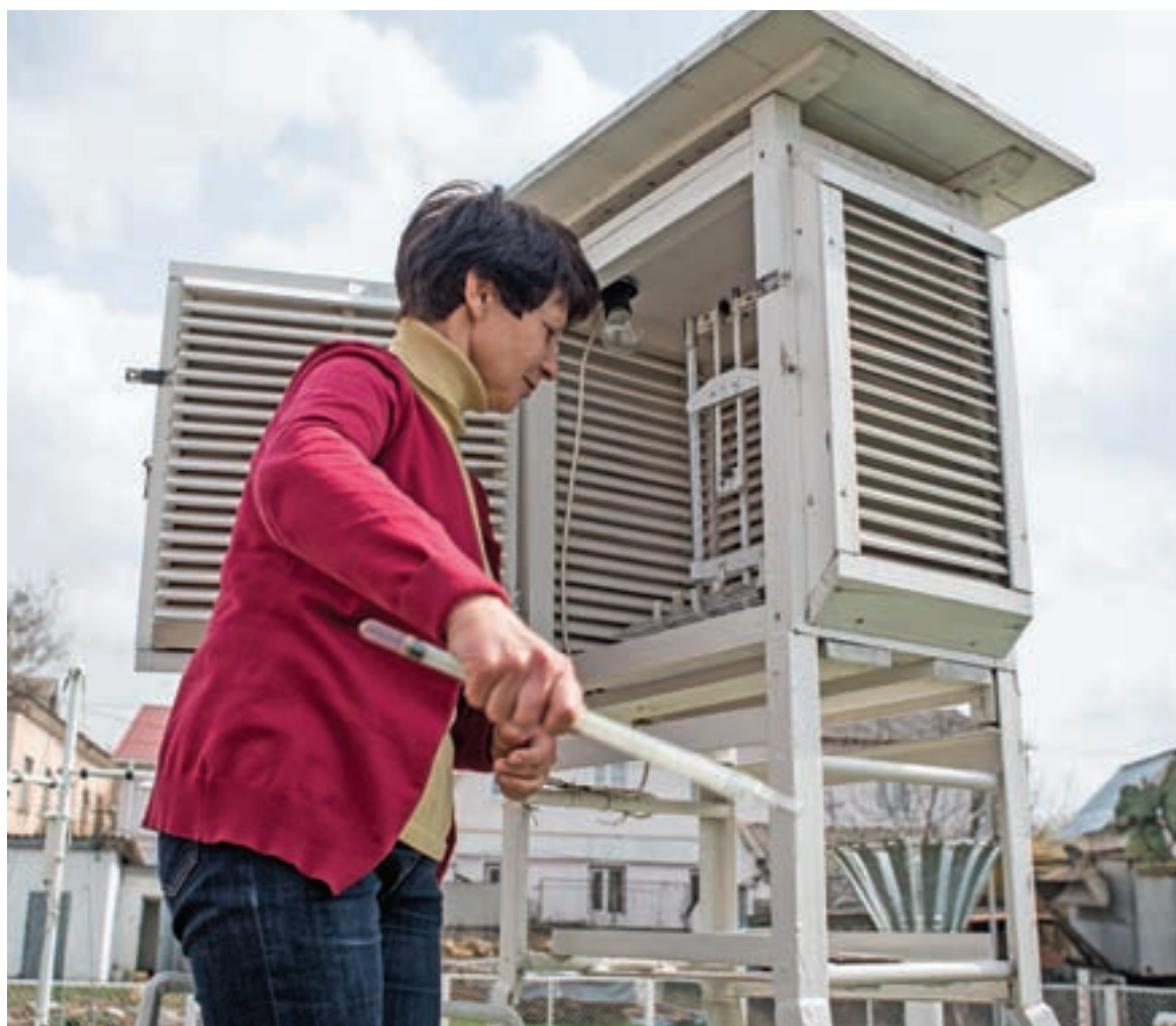
Метеоролог-наблюдатель фиксирует температуру и влажность с помощью психрометрической будки.

Сопредседатель Ялтинского международного экономического форума Андрей НАЗАРОВ об участии в нём делегации европарламентариев.