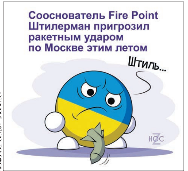
Карикатура: телеграм-канал «НОС»

ского режима сеют панику в Прибалтике дронами, которыми так щедро наделяют их европейцы. И, надо отметить, пока ни один украинский беспилотник не был остановлен литовским болотом. Но что значит какой-то заблудившийся дрон, ведь литовская трясина рождена, чтобы останавливать армии! Ну а мы считаем, что проект Вильнюса нужно масштабировать – превратить в настоящее болото всю Европу. Ведь в народе давно уже говорят: «Чем бы в там ни тешили, лишь бы поквакали».