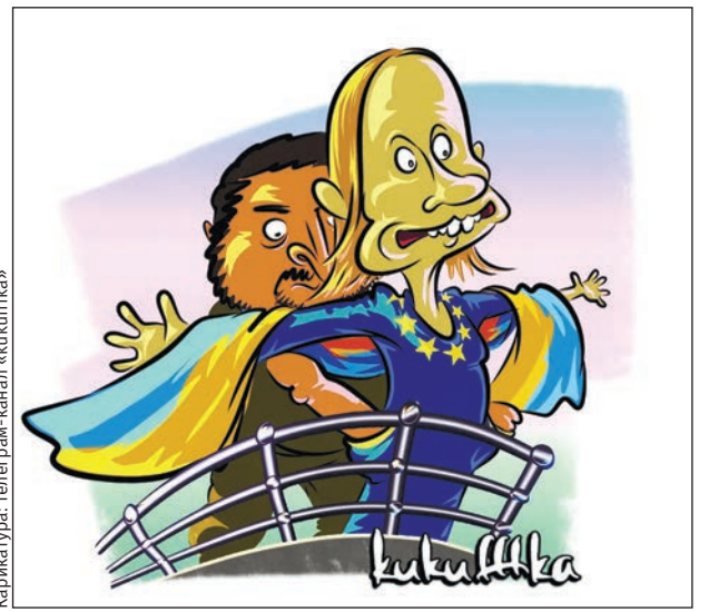
Карикатура: телеграм-канал «kukufka»

– Да я думаю, что... Клиент: – Наллевать, что ты думаешь, бери деньги и иди делай! Адвокат берёт чемодан, пожимает плечами и уходит. Судья оглашает приговор: один год тюрьмы! Клиент в восторге, зовёт своего адвоката и спрашивает: – Скажи честно, трудно всё-таки было уломать судью дать мне только один год тюрьмы? Адвокат: – Ужасно трудно! Он хотел тебя оправдать! *** Наши дни. Германия. – О боже! Русские подбросили скелеты динозавров! – Женщина, это палеонтологический музей! *** – Чем занимаетесь? – Психологией. – Лечите? – Нет, психую!