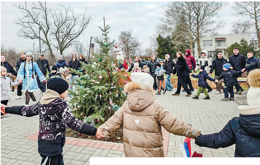
На днях в селе Михайловка Нижегородского района открыли новое место для семейного отдыха.