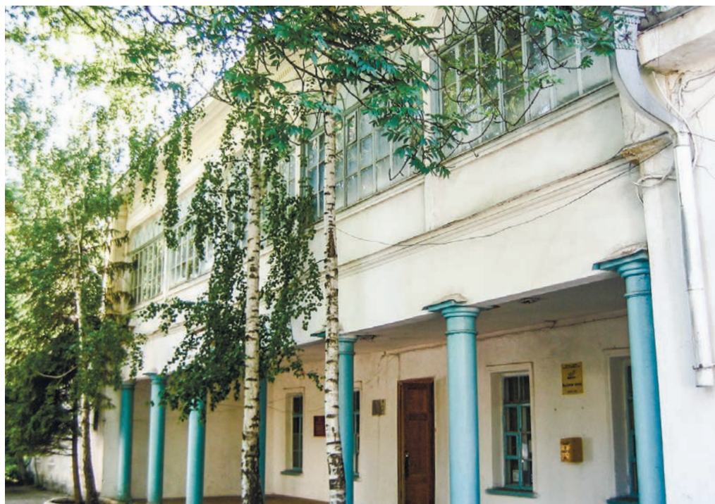
Несмотря на многочисленные перестройки, барский дом ещё хранит черты былой красоты.

“ ВЛАДЕЛЕЦ ИМЕНИЯ САБЛЫ НИКОЛАЙ МОРДВИНОВ СПЕЦИАЛЬНО ДОСТАВИЛ В САНКТ-ПЕТЕРБУРГСКУЮ АКАДЕМИЮ НАУК ОБРАЗЦЫ ГОЛУБОЙ ГЛИНЫ. ОНА ОКАЗАЛАСЬ НАСТОЛЬКО ЗНАЧИМОЙ В ПРОМЫШЛЕННОСТИ, ЧТО ИЗУЧАТЬ ЕЁ ЗАЛЕЖИ НА МЕСТЕ ОТПРАВИЛСЯ АКАДЕМИК ГАБЛИЦ. ОН ОТМЕЧАЕТ ДВА ГЛАВНЫХ МЕСТОРОЖДЕНИЯ КЕФЕКИЛИТА – ИНКЕРМАНСКОЕ И САБЛЫНСКОЕ