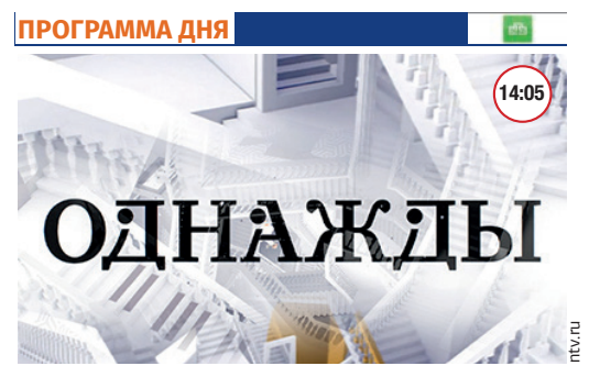
Программа дня «ОДНАЖДЫ» 16+

Американец Кейси Штайн, в прошлом профессиональный угонщик, скрывается от правосудия в Кельне.