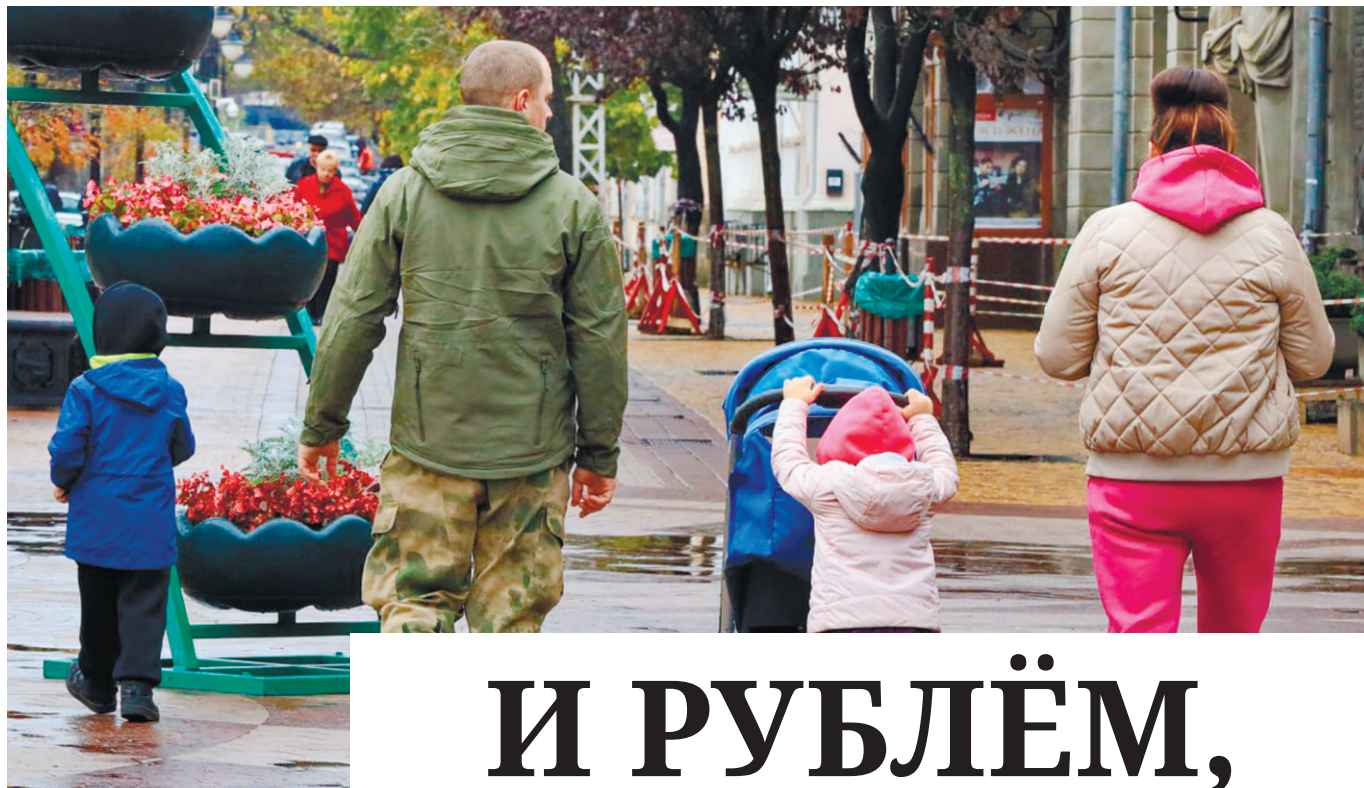
Важно формировать интерес и стремление к созданию, а главное, сохранению семьи.