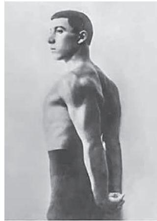
«Лурих III сын Луриха I» (1920) Уроженец Симферополя, поэт Илья Сельвинский в юности выступал в борцовских поединках в цирке под именем Лурих III, сын Луриха I.

В 1939 году Султан тоже попробовал свои силы в искусстве канатоходца: в Симферополь приехал цирковой коллектив, а коронным номером было выступление дагестанских родственников Амет-Хана. Молодые цовкринцы не только выделяли на канате сложнейшие акробатические упражнения, но и танцевали лезгинку! Юноша восхищённо наблюдал за ребятами, навистил их во время репетиции, и ему предложили пройтись по натянутому канату. Однако с первого раза не получилось. Руководитель группы подначил: «Это ж тебе, брат, не самолёт с мотором, тут самому равновесие держать нужно! Хочешь, научим?» Предложение земляка поддержал отец Амет-Хана. Самолёты были ещё в диковинку, и он искренне желал, чтобы у сына была интересная и денежная профессия. Однако Султан проявил настойчивость и выбрал небо. Впереди у него были две «Золотые Звезды» Героя Советского Союза и звание лётчика-испытателя.