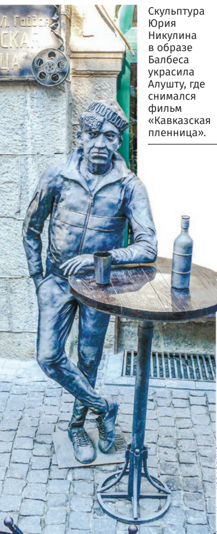
Скульптура Юрия Никулина в образе Балбеса украсила Алушту, где снимался фильм «Кавказская пленница».