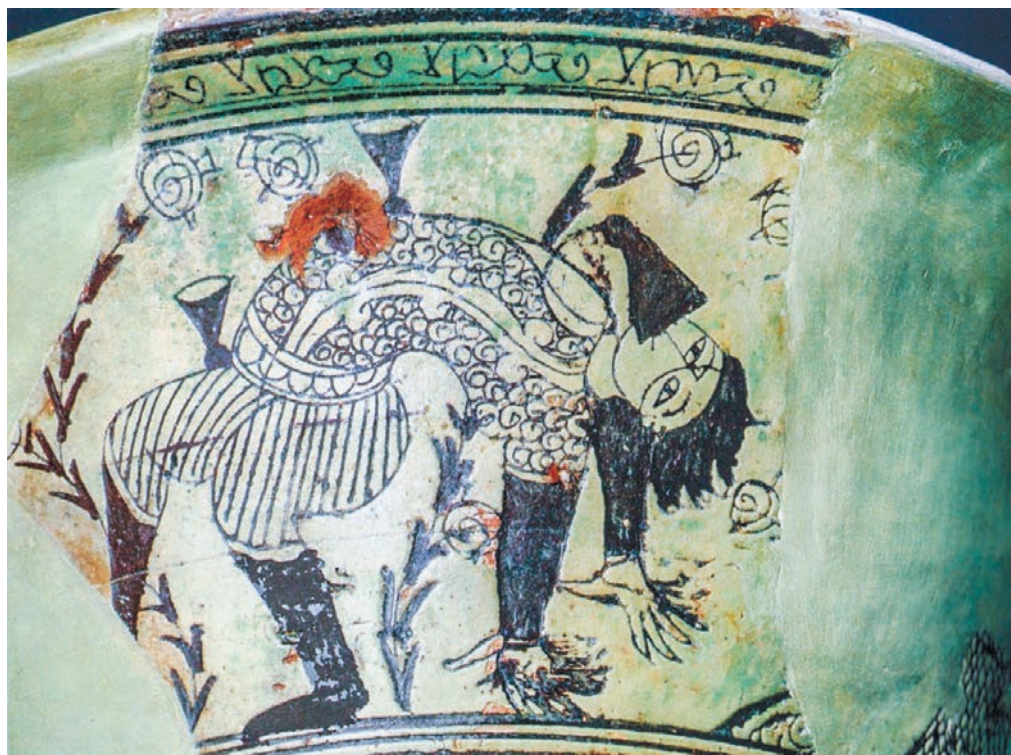
Фрагмент чаши с изображением акробата повествует о жизни нынешнего города Старый Крым в XIII–XIV столетиях.