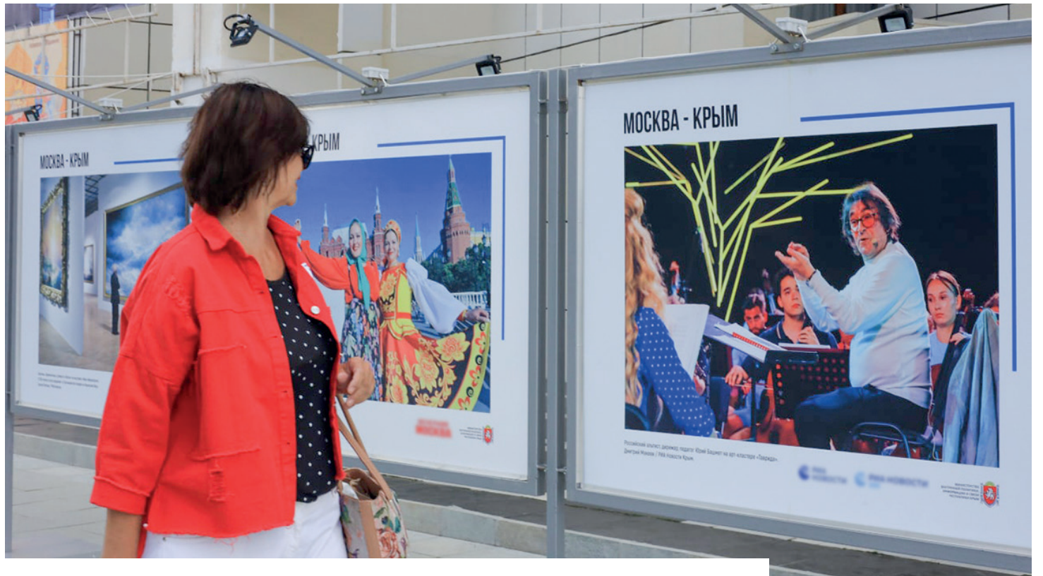
Выставка уже открыта и доступна для всех желающих.

Президент России Владимир ПУТИН на заседании Президиума Госсовета по вопросам развития туризма.