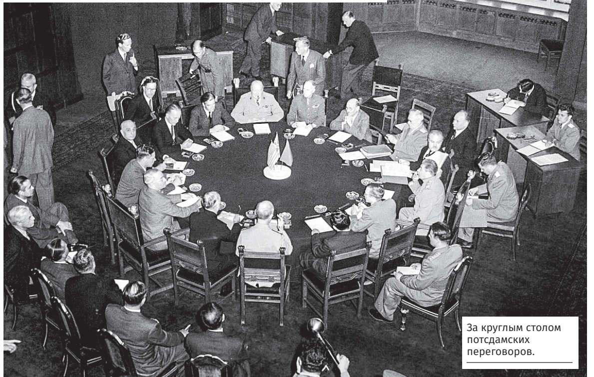
За круглым столом потсдамских переговоров.

Таким образом, избрание Потсдама, в котором впервые публично сплелись воедино государственная и нацистская составляющие гитлеровского рейха, местом проведения конференции, зафиксировавшей его крах, оказалось не лишённым символизма. Но главным критерием при выборе стало не это, а банальный прагматизм. Центр города с его дворцами, парками и вилами почти не постра-