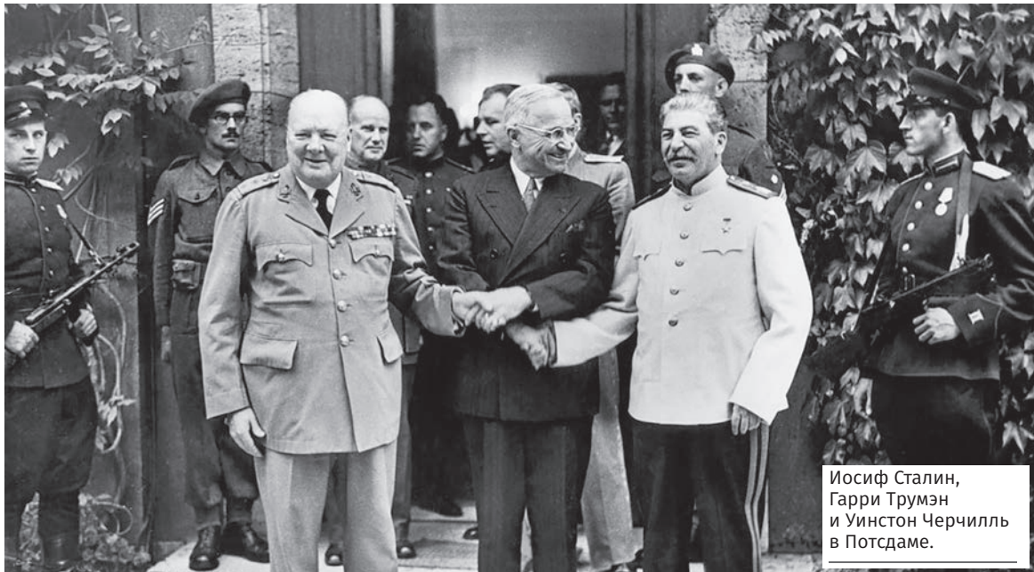
Иосиф Сталин, Гарри Трумэн и Уинстон Черчилль в Потсдаме.

Согласование даты начала конференции и места её проведения вызвало некоторые разногласия между будущими участниками