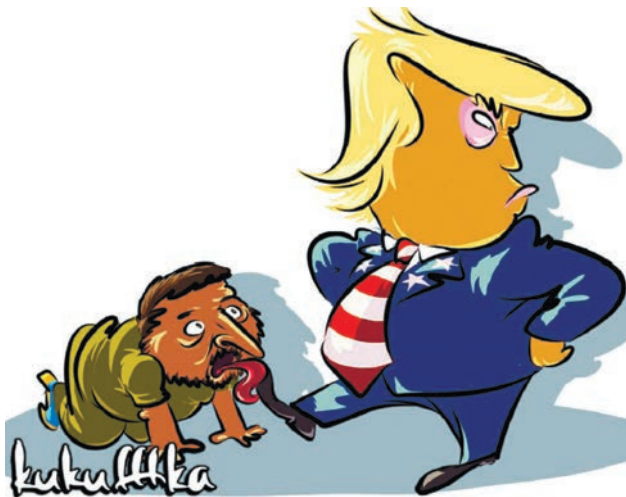
Карикатура: телеграм-канал «kukuffka»