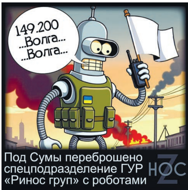
Карикатура: телеграм-канал «Нос»

этому и реакции на громкое заявление почти не было... Точнее, россияне подсчитали, что ультиматум Трампа заканчивается 3 сентября, в так называемый Шуфутинов день, когда переворачивают календарь и горят костры рябин. Видимо, США только предстоит узнать, что это за особый у нас день такой. Однако американские СМИ уже стали задаваться вопросом «Но почему?», констатируя, что в России мало обеспокоились по поводу угроз Трампа. А у него ведь всё было всерьёз... второго сентября.