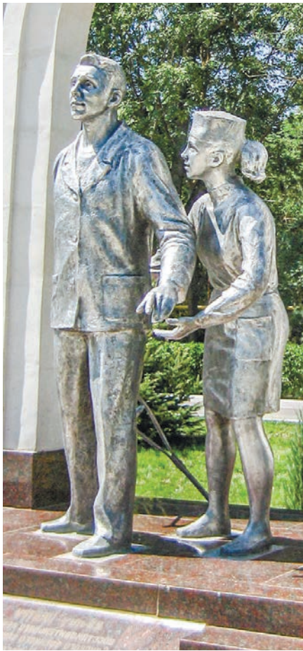
Выразительный памятник «Исцеление страждущих» установлен в парке Сакского военного санатория имени Н. И. Пирогова.