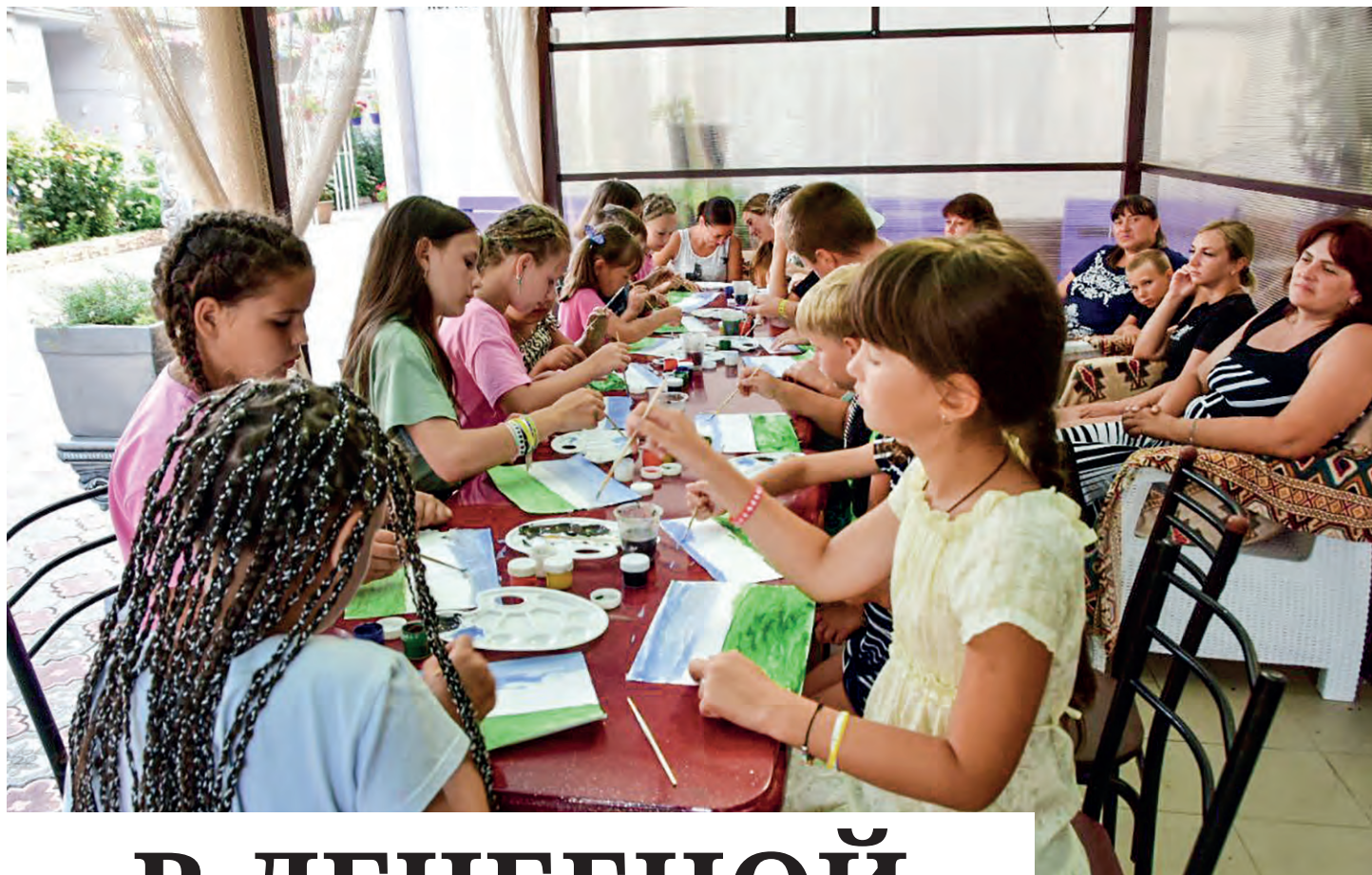
Межводное. Гостевой дом «Дельфин». 15 августа. Дети из Луганской Народной Республики рисуют лавандовое поле на занятии с аниматором.

27 августа, в День российского кино, в 19:00 на Театральной площади Евпатории состоится торжественное открытие Фестиваля детского и семейного кино «Солнечный остров».