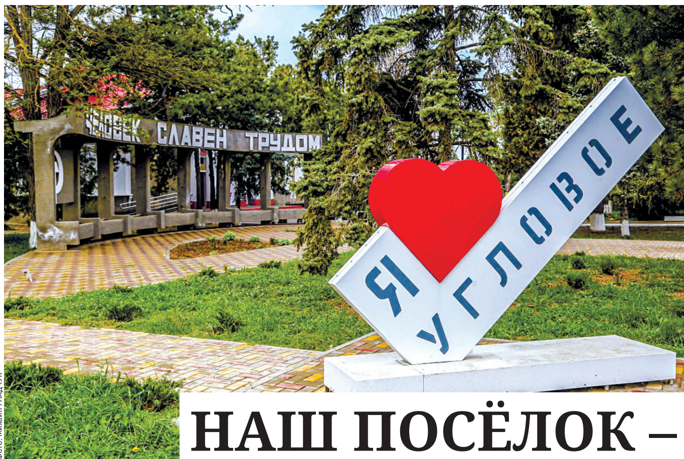
Фото: Михаил ГЛАДУК