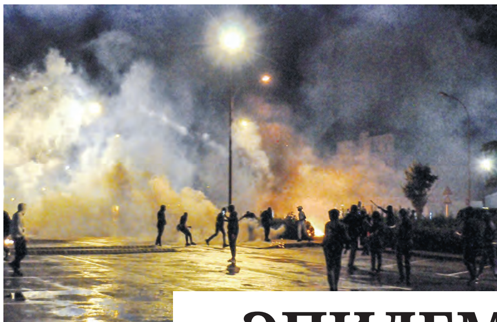
За участие в беспорядках во Франции полиция задержала около 3,6 тысячи человек.