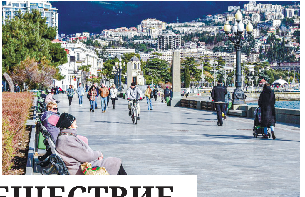
Курорт в ожидании праздника.

И добавил, что непростой 2023 год туристическая отрасль Крыма отработала с честью, получив экономические показатели не намного ниже, чем в предыдущие периоды.