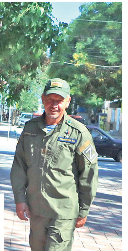
Владимир Владимирович гордится подрастающим поколением.

– Когда выступаю перед детьми, то пытаюсь донести до них, что мы воюем не с Украиной и не с украинцами. Мы сражаемся против нацизма и фашизма на территории Украины. Противостояние идёт с коллективным Западом, с НАТО. Если бы 24 февраля президент не отдал приказ о начале СВО, то 8 марта Крым бы уже накрыли ракетным ударом. Победа будет за нами, в этом нет никаких сомнений. Нынешняя ситуация коснулась всех жителей