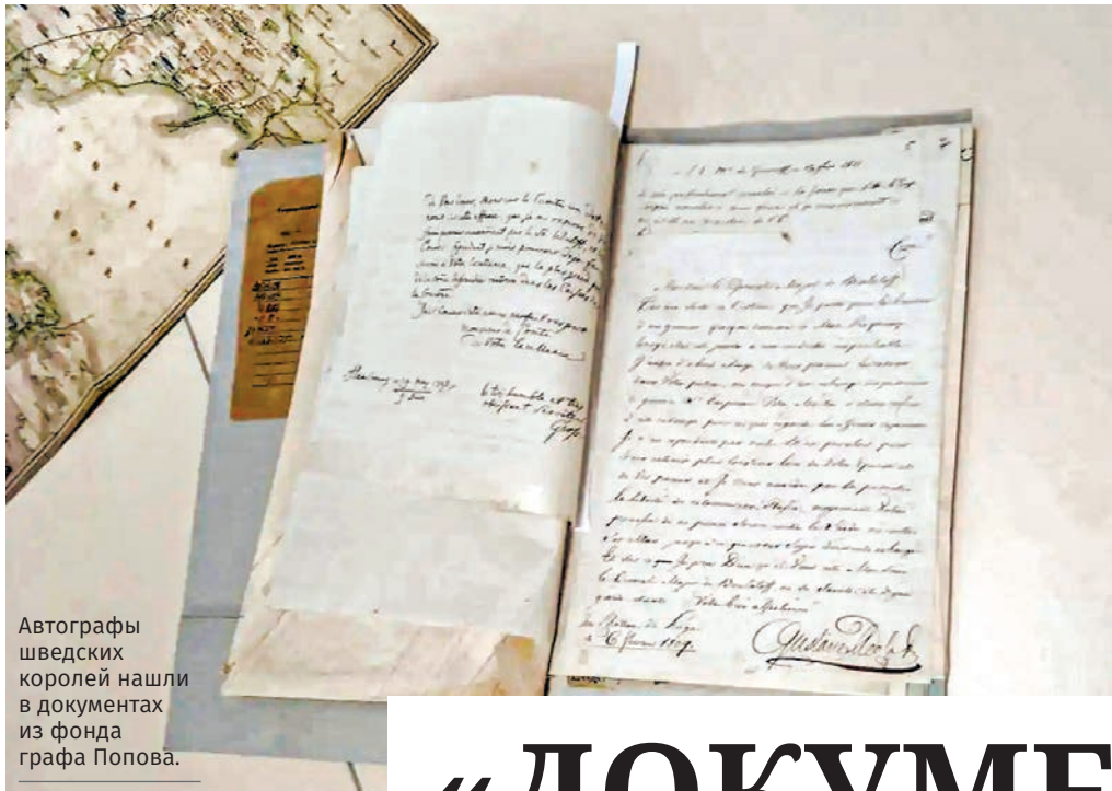
Автографы шведских королей нашли в документах из фонда графа Попова.