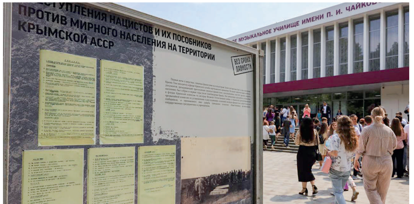
Фото архивных документов смотрите на сайте gazetacrimea.ru .

Вчера в Симферопольском музыкальном училище имени П. И. Чайковского состоялось открытие фестиваля документального кино «Дорогами памяти и славы» в рамках Общероссийского общественного движения «Без срока давности». Мероприятие приурочено к началу суда над карателями на территории Крыма, в Симферополе. На фестивале представлены документальные фильмы, основанные на реальных событиях, они подкреплены научными исследованиями и недавно рассекреченными архивными материалами.