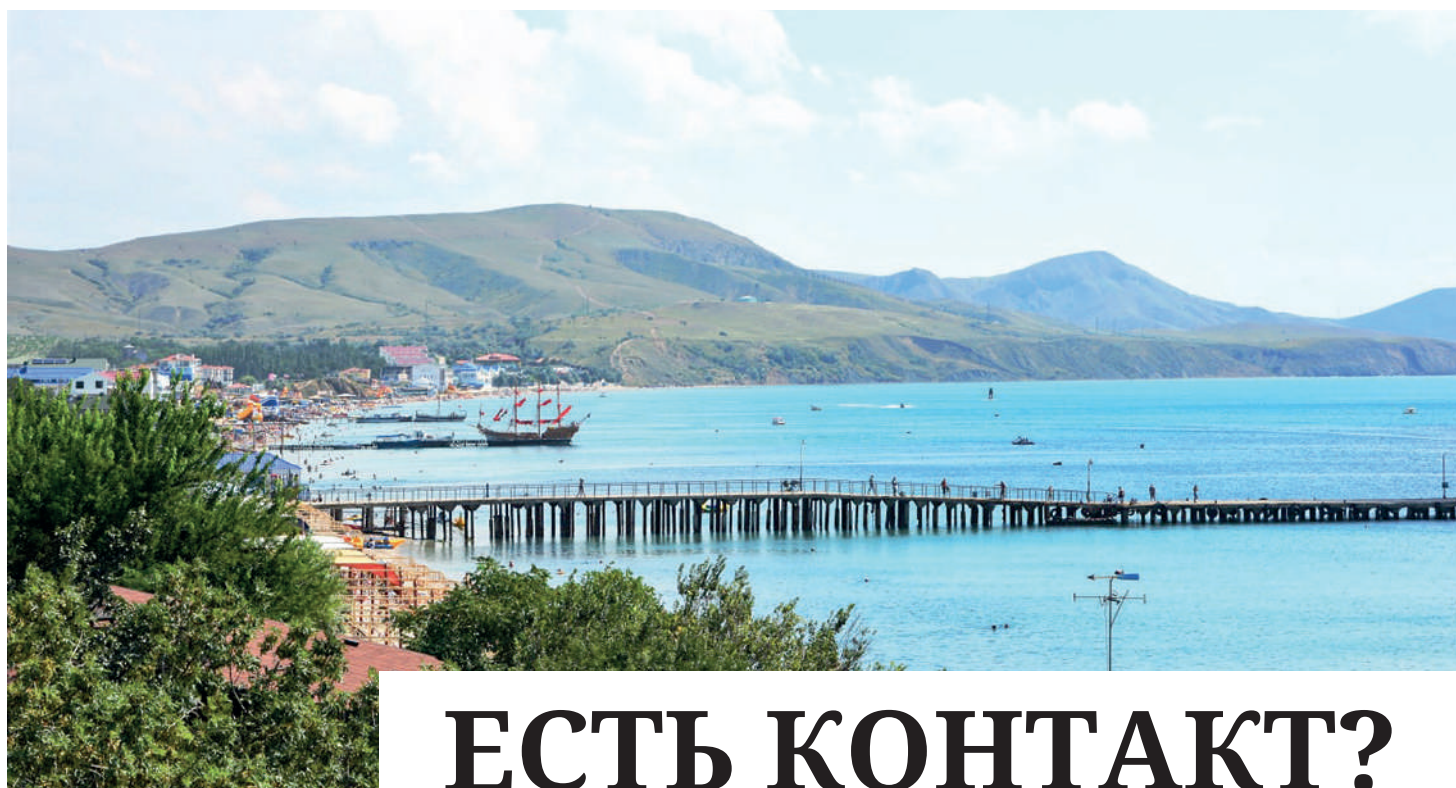
В райском уголке Коктебеле, как и по всей Феодосии, море проблем.