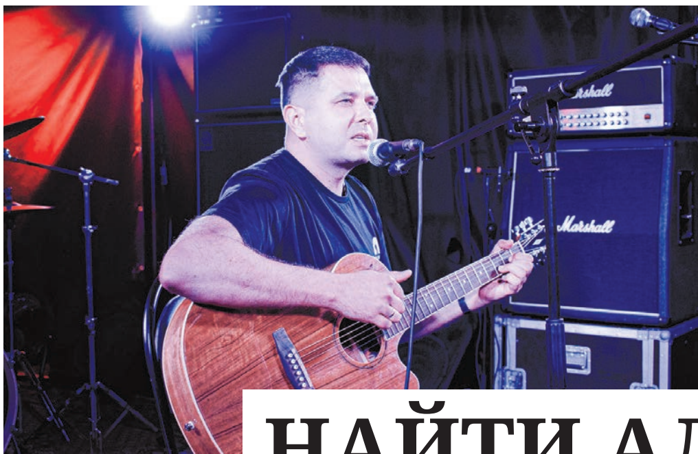
Один из участников музыкального вечера.