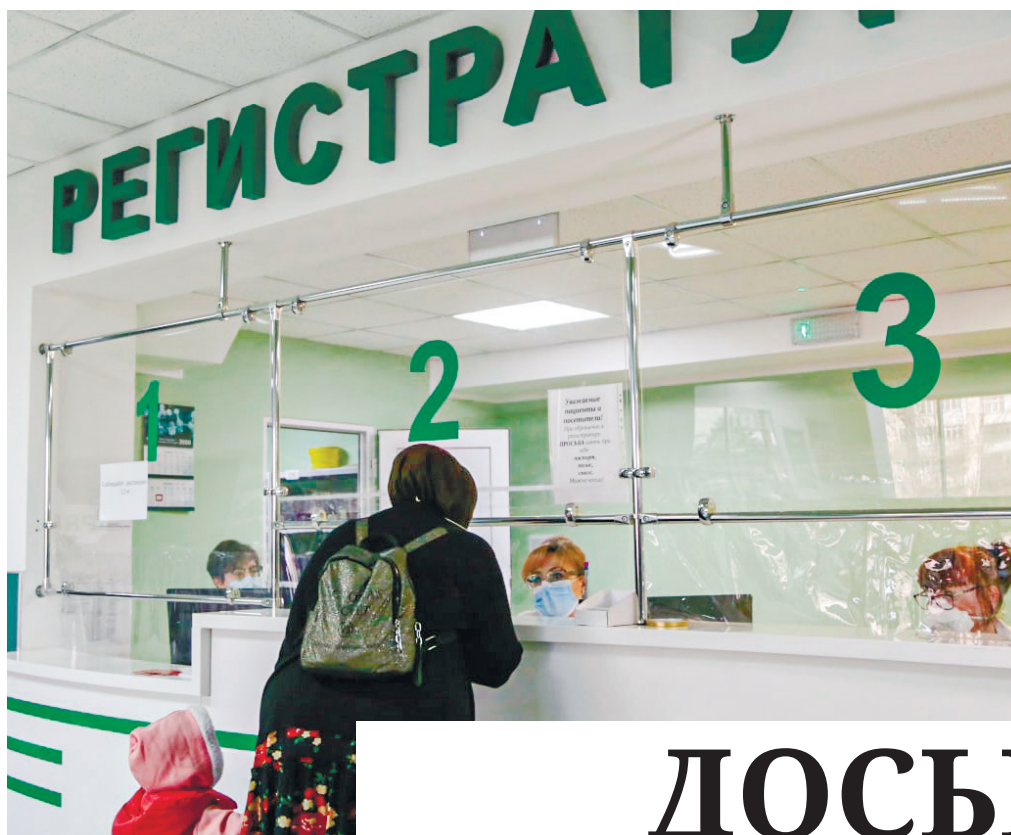
Современные технологии решают проблемы очередей в регистратуру и потери медкарт. На фото: поликлиника ГБУЗ РК «Симферопольская ГКБ № 7».