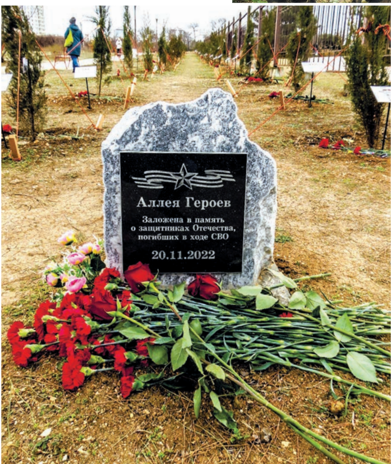
У закладного камня Аллеи Героев СВО всегда свежие цветы.