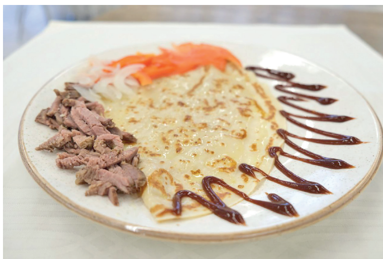
Когда блин становится произведением гастрономического искусства.

По словам нашего собеседника, современные заведения всё реже концентрируются на одной национальной кухне. Чаще всего в одном месте встречаются русская, европейская, азиатская кухни – вот такое выходит гастрономическое товарищество.