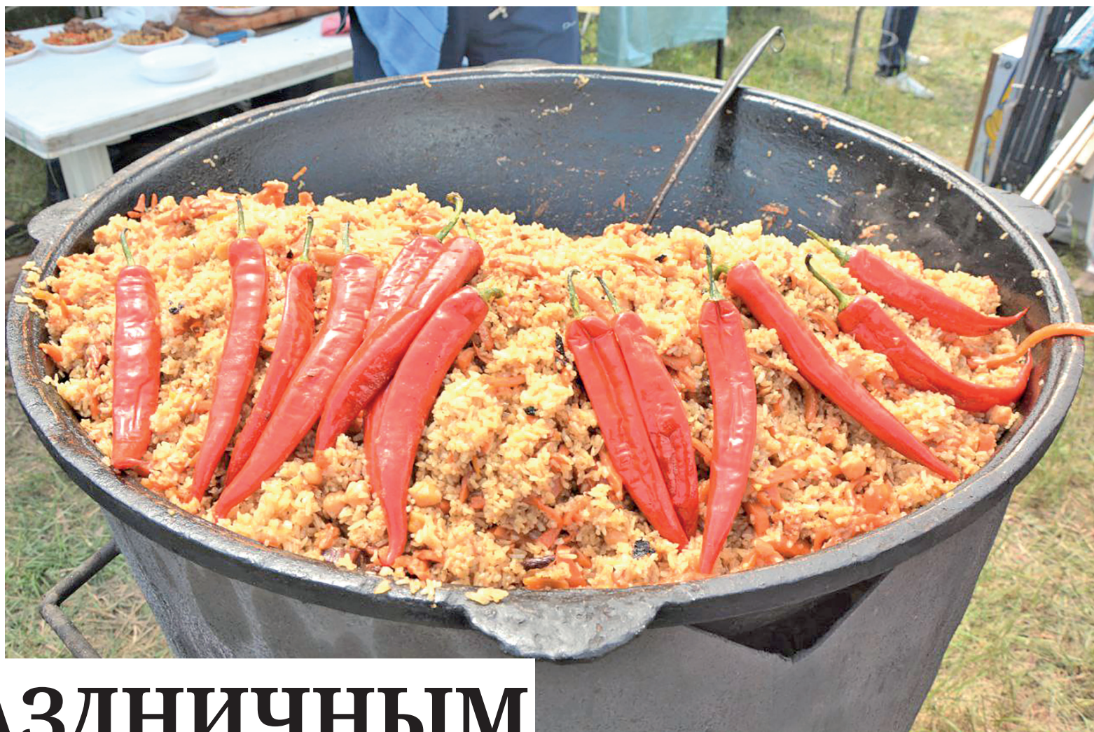
Плов можно увидеть на многих массовых мероприятиях.

– Здесь переплелись между собой кухни не только народов России, но и всего мира. Крымские повара очень любят экспери-