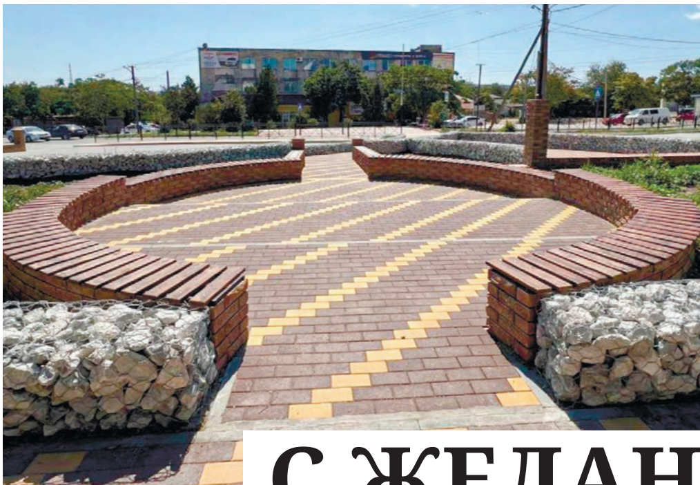
В посёлке Черноморское, на улице Южной пешеходные дорожки и площадки вымостили тротуарной плиткой.