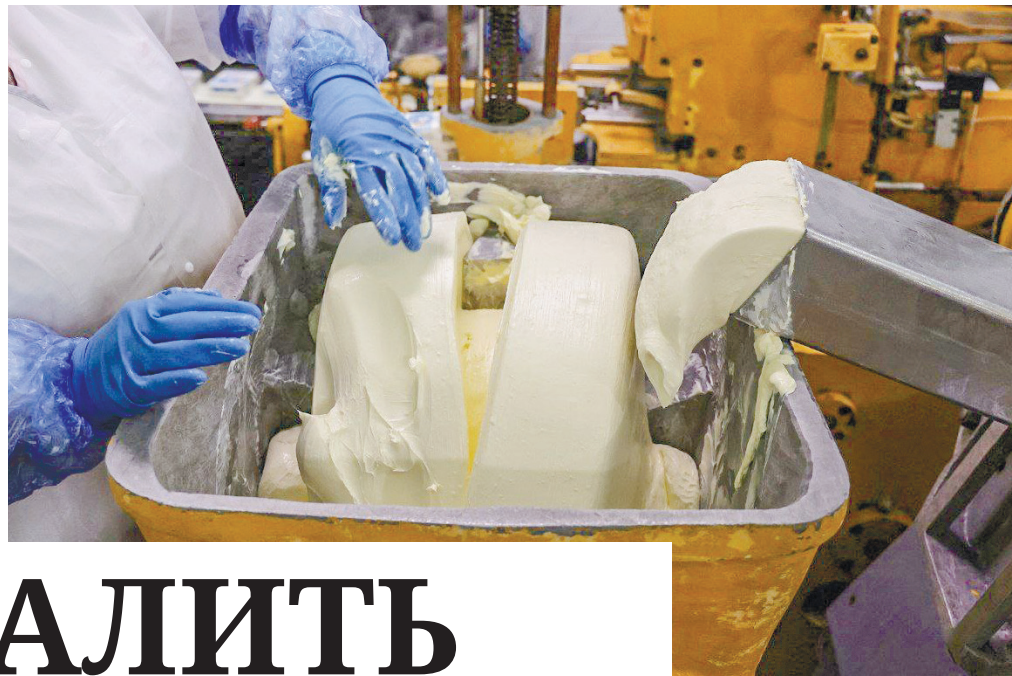
Один из этапов расфасовки масла.

– У нас 90% молока – это местное, крымское, а два раза в неделю ферма «Таврия» в Херсонской области поставя-