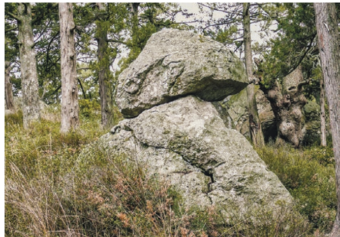
Загадочный «алтарь нимф». Игра природы или дело рук человеческих?

Лавр, взращённый царской рукой, уничтожили геополитические бури XIX и XX столетий. Было бы справедливо, заручившись поддержкой администрации