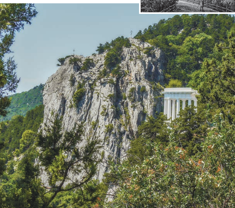
С Царской тропы вид на Крестовую скалу впечатляет.

Ялтинского горно-лесного заповедника, высадить на Крестовой новое деревце в память о преобразователях Тавриды.