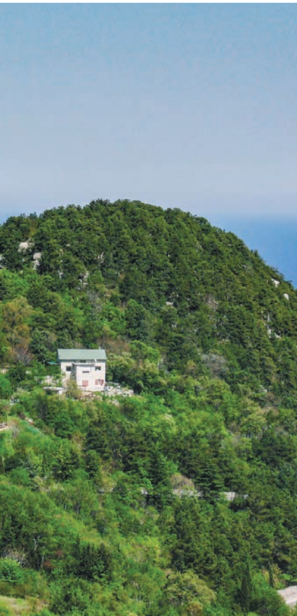
Невысокая горка, покрытая лесом, – таково первое впечатление о горе Ореанда-Исар.