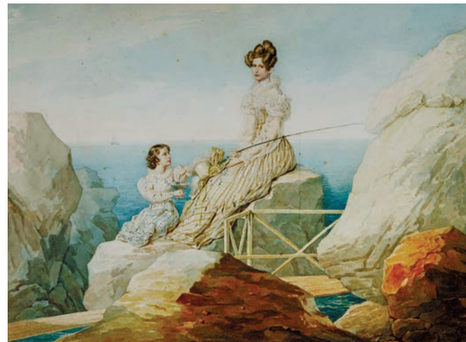
Счастливая хозяйка имения императрица Александра Фёдоровна с дочерью на берегу моря.

Расположившись в алуэпской резиденции правителя Крыма Михаила Воронцова, Александра Фёдоровна в течение сентября несколько раз приезжала в Ореанду: прогуливалась по округе, планировала территорию парка и конфигурацию построек. Благодатная природа сотворила чудо – болезненная женщина буквально расцвела.