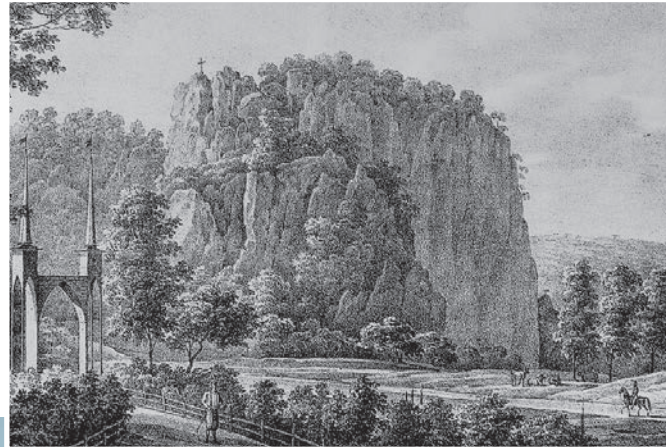
Крестовая скала в Ореанде, 1840-е годы.

Древние обитатели Тавриды считали мир планеты одушевлённым и обустроивали капища, пытались подношениями задобрить духов, от которых зависело благополучие селения. Очень может быть, что в далёком прошлом