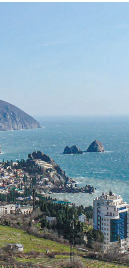
«Медвежий угол» на Южном берегу: топонимы Гурзуф созвучен с латинским словом «урсус», Артек – с греческим «арктос», Аюдаг в переводе с крымско-татарского – «Медведь-гора».