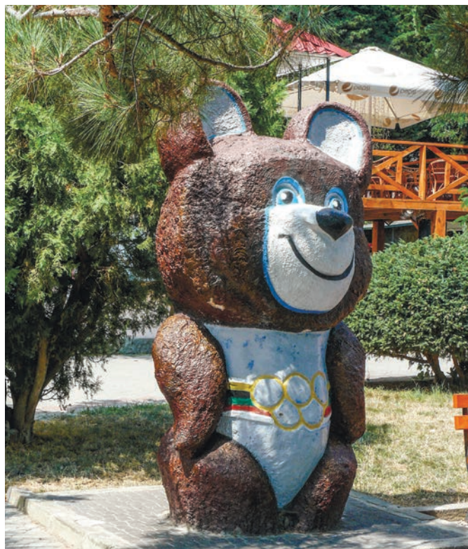
«Олимпийский Мишка», официальный талисман летних Олимпийских игр, проходивших в Москве.

Поскольку в поисках еды Топтыгину необходимо