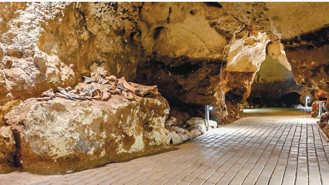
В пещере «Таврида», рядом с останками древних гиен, саблезубых кошек, верблюдов, обнаружены кости медведя, обитавшего в Крыму около полутора миллионов лет назад.

было прошерстить обширные территории, в Крыму соседство человека и медведя оказалось не в пользу последнего: со временем наши мишки были в дикой природе истреблены. Но взаимоотношения людей и животных перешли в новое качество.