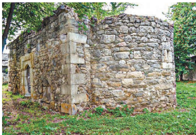
Средневековая церковь в центре Солхата имела форму ковчега – корабля, несущегося по бурному океану жизни.

До нас дошли руины трёх зданий. Материальные остатки средневековой рос-