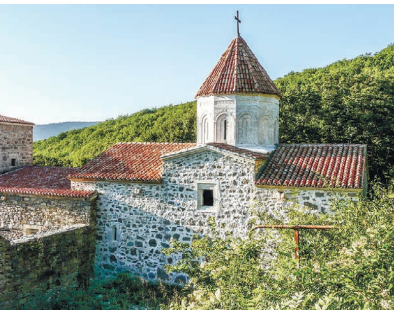
Монастырь Сурб Хач (в переводе с армянского – «Святой Крест») ведёт историю с XIV века.

Все главные новости Крыма в «Крымской газете»