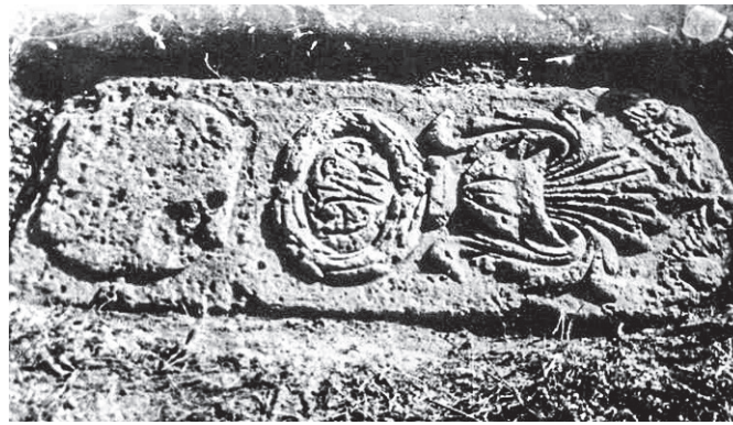
В экспозиции Старокрымского литературно-художественного музея можно увидеть уникальное фото – надгробие авантюристки, чей образ вдохновлял Александра Дюма.

Не менее захватывающей выглядит история Жанны Валуа, она же графиня де ла Мотт, она же графиня де Гаше. Образ роковой женщины, чьи похождения шли рука об руку с грандиозными аферами, вдохновил Александра Дюма на создание романа «Ожерелье королевы». В Миледи из «Трёх мушкетёров» также угадываются черты ловкой интриганки.