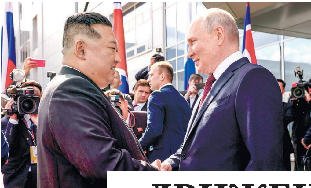
Ким Чен Ын: Пхеньян хочет и дальше развивать двусторонние отношения с Москвой.