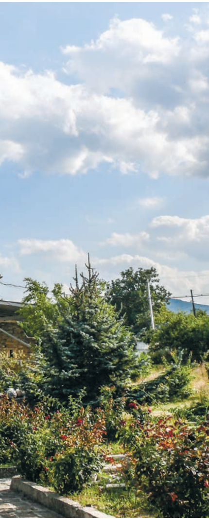
Мечеть, построенная ханом Узбеки, олицетворяет эпоху расцвета города.

разом, ныне действующая мечеть Узбека является старейшей в Восточной Европе.