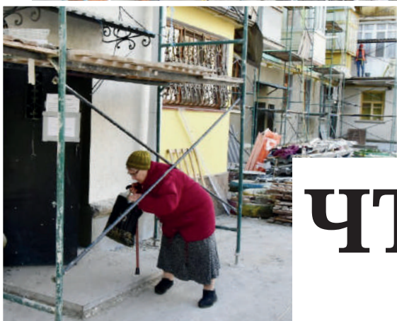
Жильцы дома № 16/31 на улице Павленко, в Симферополе, очень рады, что дождалась капитального ремонта.