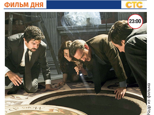
«АНГЕЛЫ И ДЕМОНЫ» 16+