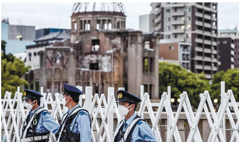
В Хиросиме были предприняты беспрецедентные меры безопасности для охраны участников саммита G7.