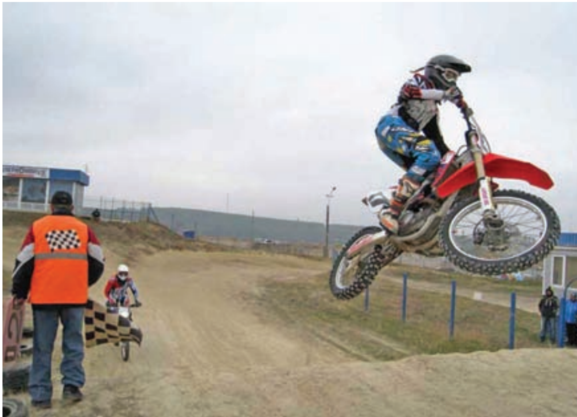
В Крыму стартовали чемпионат и первенство республики по мотокроссу.

Чемпионат разыгрывается в двух классах – 125 и 250 кубических сантиметров. Что касается первенства, то тут их больше – 50, 65 и 85 «кубиков». А ещё есть категории любителей и три ветеранских класса. Эти спортсмены соревновались в зачёт Кубка федерации автоспорта Крыма и республиканского отделения ДОСААФ. Тут важен не только спортивный, но и организационный успех. Наконец-то удалось привлечь к участию спортсменов с