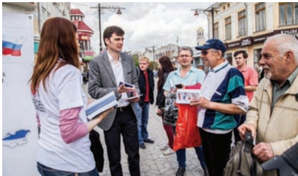
11 апреля. Симферополь. Каждый желающий получил экземпляр Конституции Крыма.

Если же говорить о Конституции России, то, по словам заместителя министра, знание главного закона оставляет желать лучшего. Лишь около 16% россиян в той или иной степени знают содержание Основного закона. Большая часть, порядка 50%, зна-