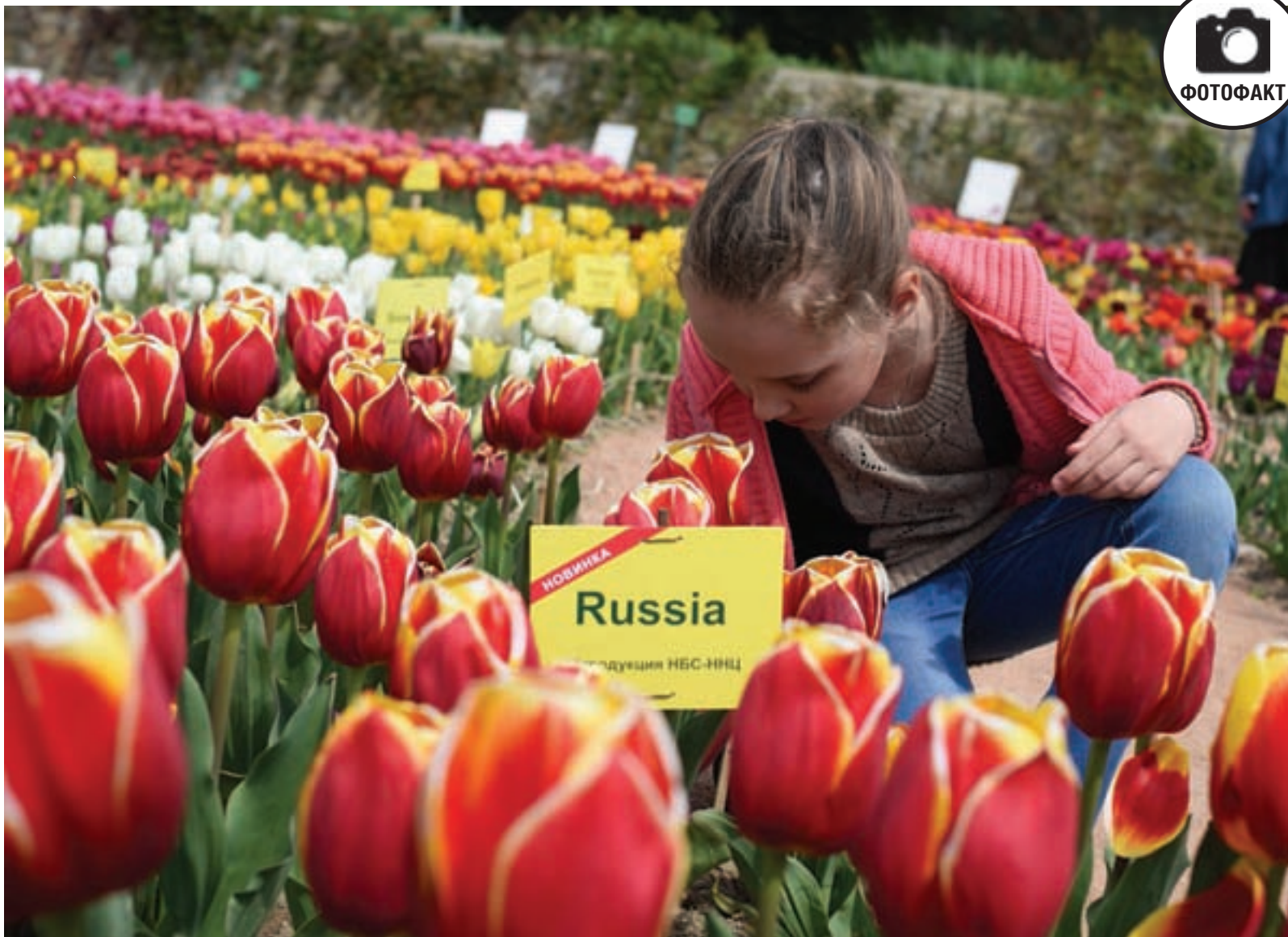
11 апреля. Никитский ботанический сад. Здесь открылась девятая выставка тюльпанов.

Оформить подписку можно в любом отделении связи Крыма