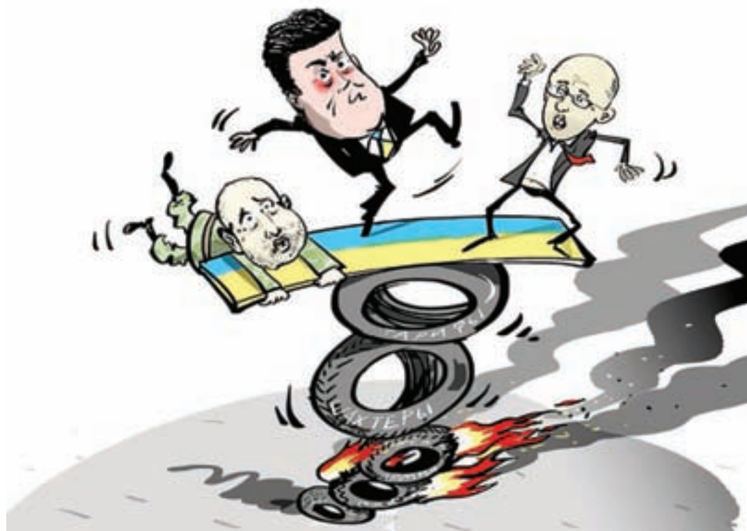
Карикатура: Виталий ПОДВИЦКИЙ / РИА

Что и говорить – всё предельно откровенно: американцы, увидев бесперспективность дальнейшего нахождения в премьерском кресле своего протеже, дали добро на его отставку. Это был выбор меньшего из двух зол. Ведь обе фигуры – и Порошенко, и Яценюка – обесценили свой политический вес и вызывают всё большее раздражение даже своих соратников. Ну, разве что у Яценюка с рейтингом совсем грустно – он уже нахо-