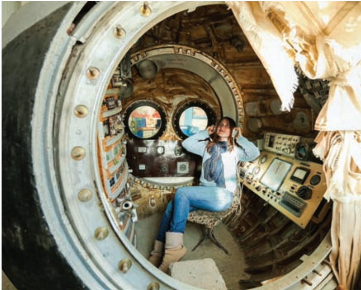
Нашему корреспонденту удалось побывать в капсуле для спасения космонавтов в музее Центра дальних космических исследований.