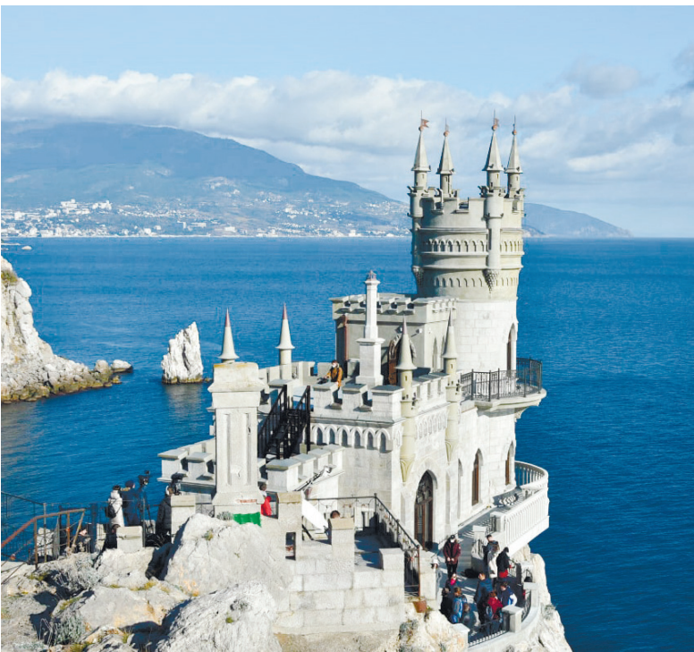
Замок «Ласточкино гнездо» предполагалось сделать местом расправы с Распутиным.

В квартире Распутина раздаётся телефонный звонок: у Алёши разболелось ухо, он плачет, не может уснуть.