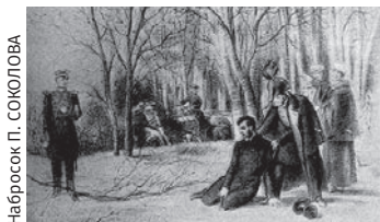
Набросок П. СОКОЛОВА