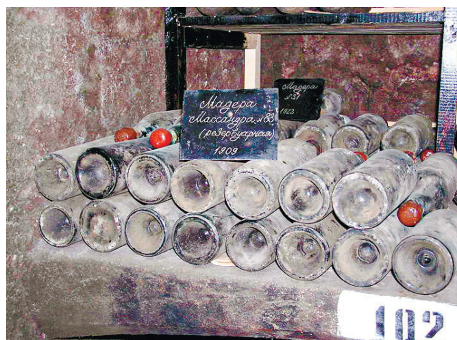
В энотке «Массандры» хранятся образцы мадеры – любимого вина Распутина.

“КРЕПКИЙ СУХОПАРЫЙ МУЖИЧОК С ПРОНЗИТЕЛЬНЫМИ ГЛАЗАМИ УМЕЛ ОБЛЕГЧАТЬ НЕ ТОЛЬКО ФИЗИЧЕСКИЕ БОЛИ, ТЕРЗАВШИЕ ЦАРЕВИЧА, НО И НРАВСТВЕННЫЕ МУЧЕНИЯ ЕГО РОДИТЕЛЕЙ. И В СКОРОМ ВРЕМЕНИ СТАЛ НЕЗАМЕНИМЫМ СОВЕТЧИКОМ НЕ ТОЛЬКО В СЕМЕЙНЫХ ПРОБЛЕМАХ