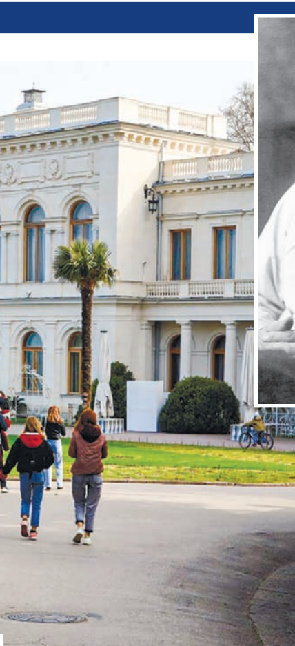
Григорий Распутин – одна из самых загадочных личностей возле российского трона.