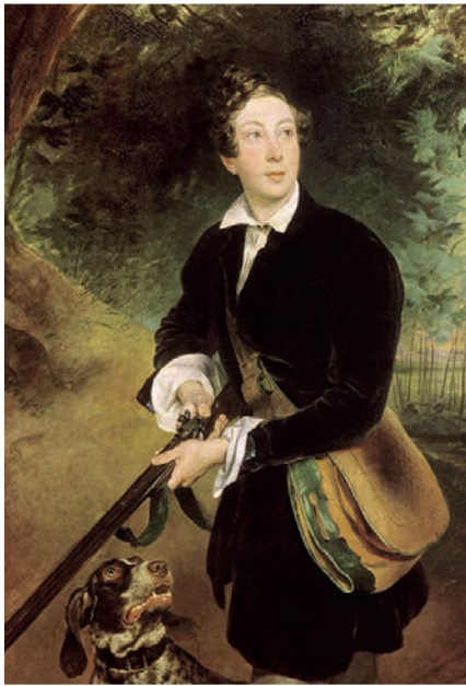
Портрет поэта и драматурга Алексея Константиновича Толстого в юности. Карл Брюллов. 1836.

Важнейшим пунктом программы вояжа стал истерзанный Севастополь. Водушевлённый подвигом