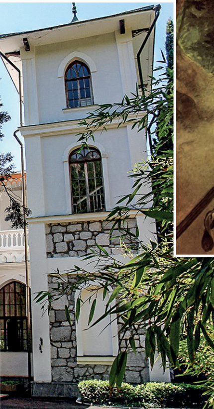
Барский дом в имении «Меллас» сохранил первозданную красоту.