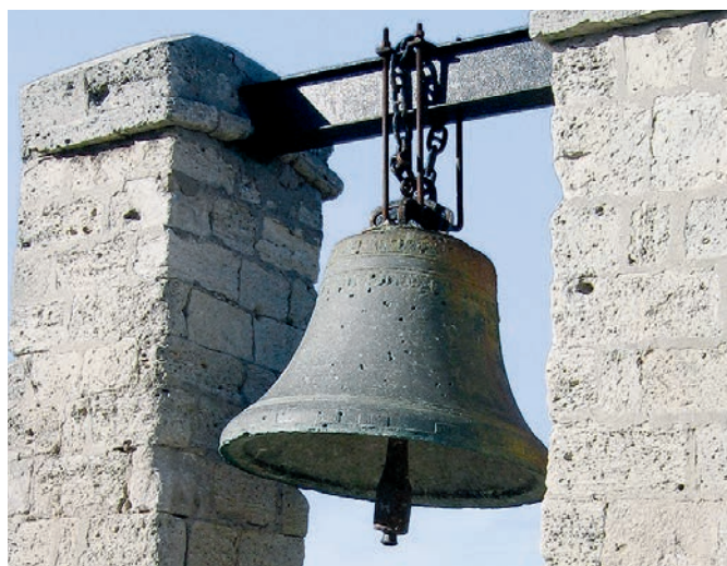
Израженный врагами колокол в Херсонесе олицетворяет грозный голос Севастополя.