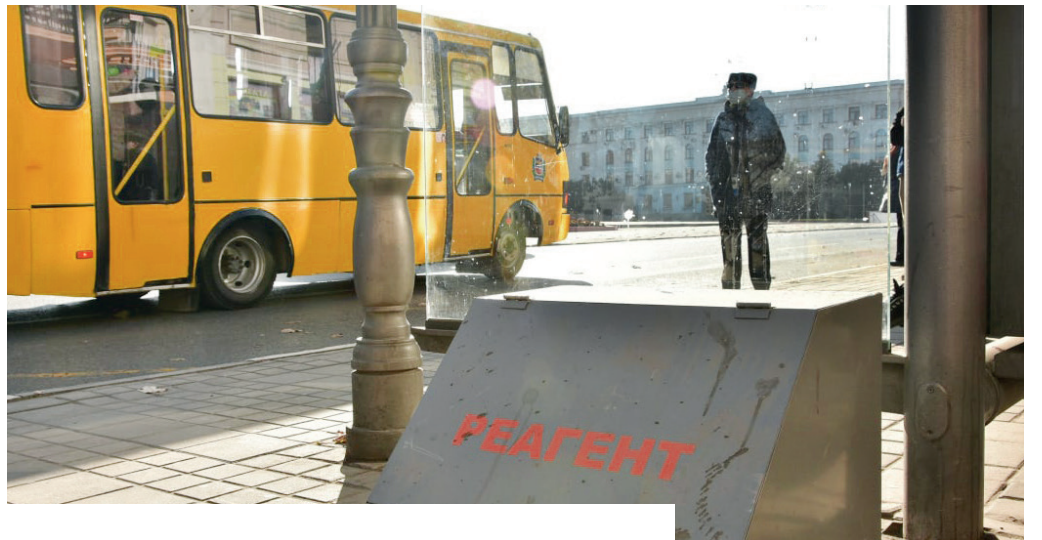
В ближайшее время похолодает, коммунальщики к гололёду готовы.

– С четверга на пятницу будет проходить холодный атмосферный фронт. Возможны осадки в виде дождя, местами сильные. 18 ноября дождь может перейти в мокрый снег.