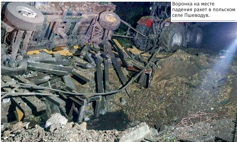
Воронка на месте падения ракет в польском селе Пшеводув.