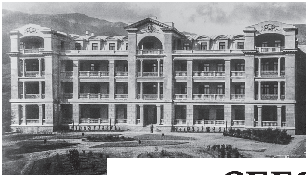
Здание как пироговский корпус открыто к 300-летию дома Романовых.