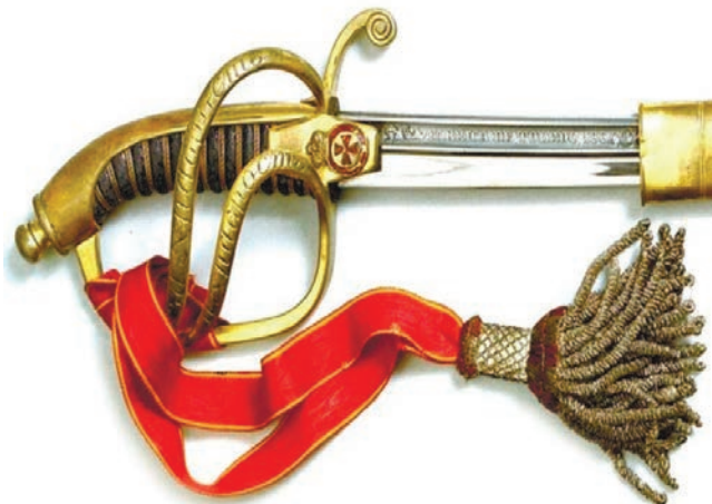
Орден Святой Анны 4-й степени «За храбрость».

Какие «севастопольские» награды заслужил Лев Толстой