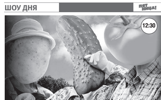
«ЧЕТЫРЕ ДАЧИ» 16+

Конечно, о женщинах. Нет, ещё о работе, о деньгах, о машинах, о футболе, но в основном всё-таки о женщинах.