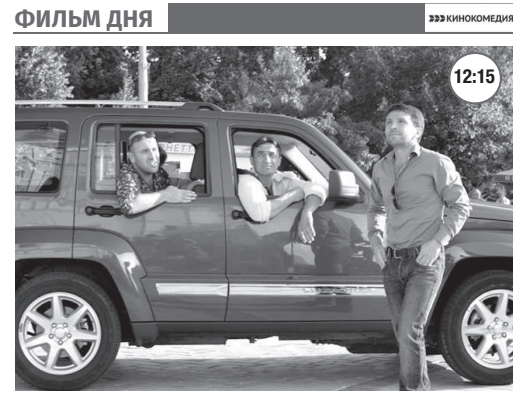
«О ЧЁМ ГОВОРЯТ МУЖЧИНЫ» 16+

Конечно, о женщинах. Нет, ещё о работе, о деньгах, о машинах, о футболе, но в основном всё-таки о женщинах.