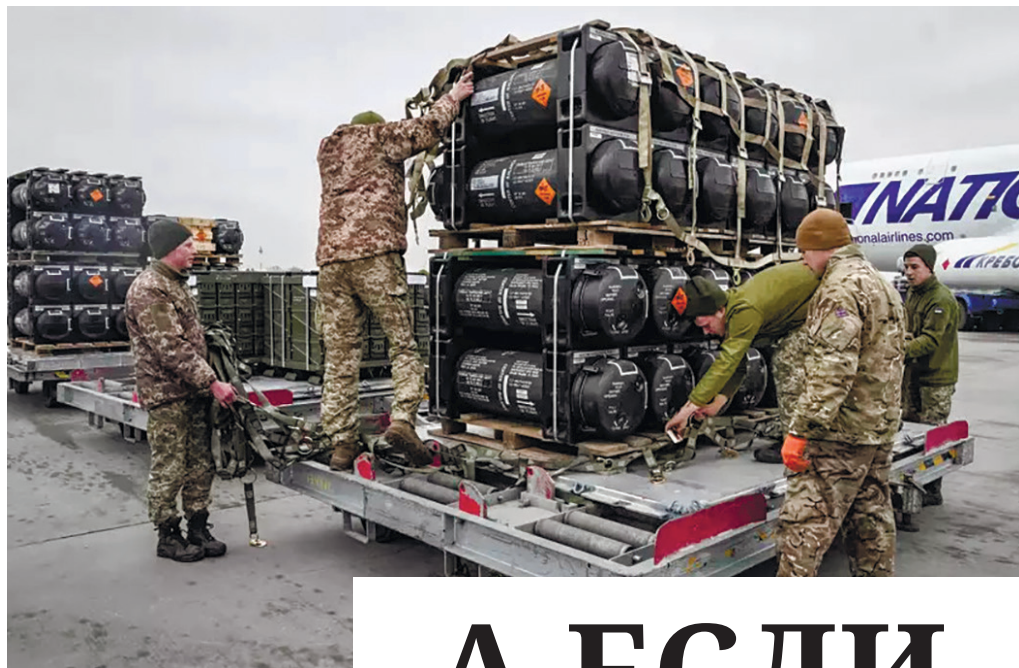
Помощь США Киеву, в том числе военная, неумолимо снижается.