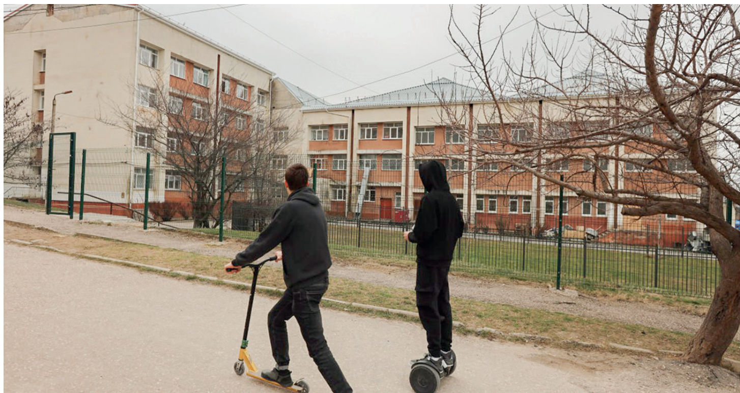
Пока школа № 36 в Симферополе закрыта на карантин, дети активно проводят время на свежем воздухе.