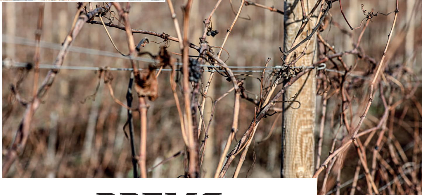
С 2014 по 2021 год в республике был заложен 5861 га новых виноградных плантаций.