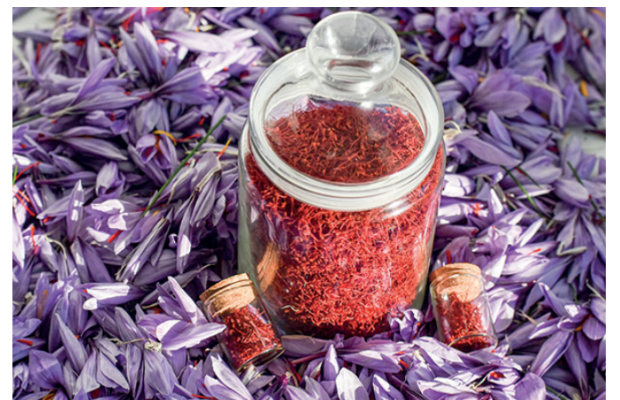
Тычинки отделяют от лепестков. Ценность представляет именно сантиметровая часть тычинки.

период в том числе запрещается добыча всех водных биоресурсов в акватории Ялтинского грузового и пассажирского портов и вдоль центральной набережной на расстоянии от берега менее 100 метров.