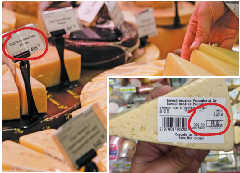
100 граммов элитного сыра стоят вдвое дороже, чем килограмм сырного продукта.

Ингредиенты: литр обычного кефира и упаковка жирной сметаны. Лучше даже не магазинной, а рыночной. Упаковку кефира поместить в морозильную камеру с вечера. Утром дать ему оттаять, смешать со сметаной, дать стечь через марлю. Немного подсолить – и вот сыр типа маскарпоне готов.