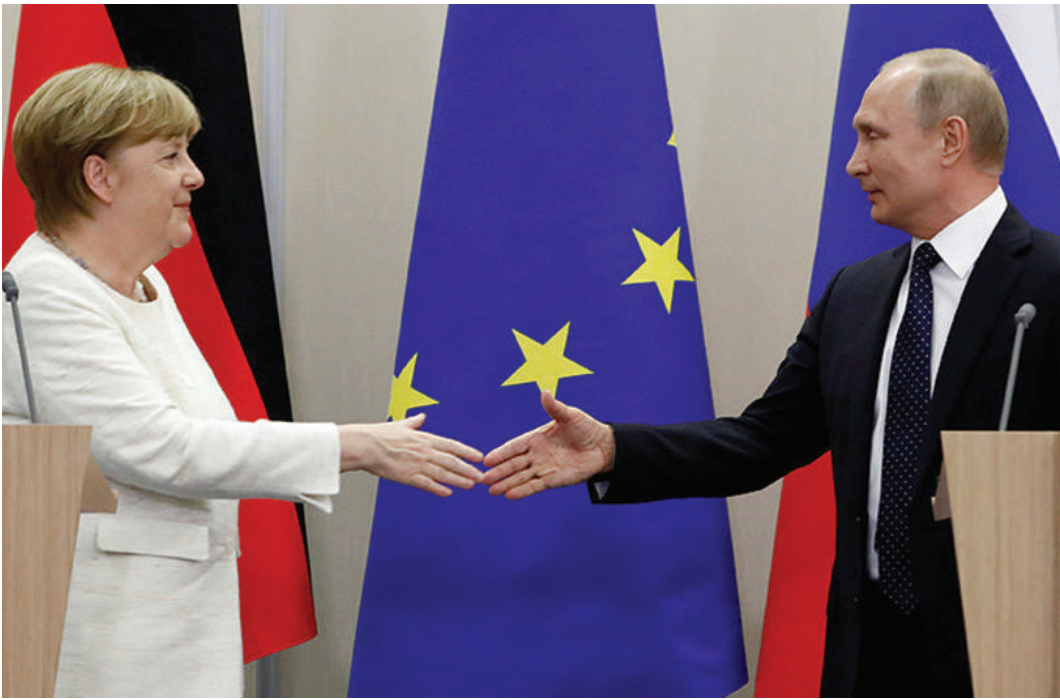
В Сочи прошли переговоры Президента России Владимира Путина и канцлера Германии Ангелы Меркель.

Канцлер, пытаясь отбиться от Вашингтона, готова «реанимировать» отношения с Москвой