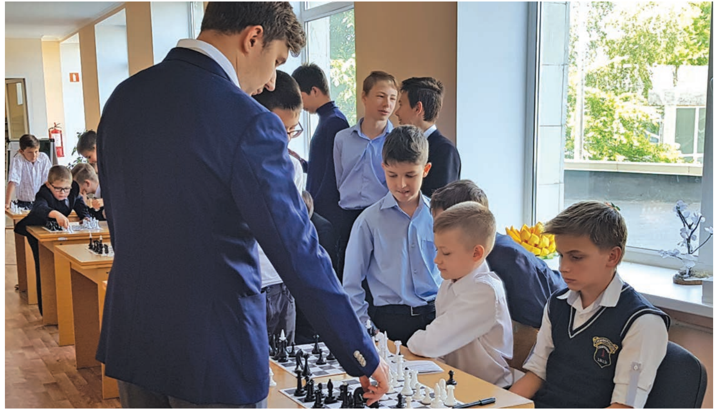
Сергей Карякин посетил родную гимназию № 1 в Симферополе.

Сергей Карякин рассказал о своём крымском турнире и предстоящих сражениях