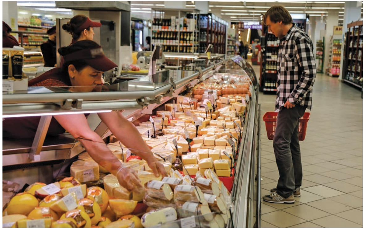
В крымских супермаркетах выбор сыра любой географии на любой кошелек.

Среди многообразия товара на прилавке легко заблудиться,