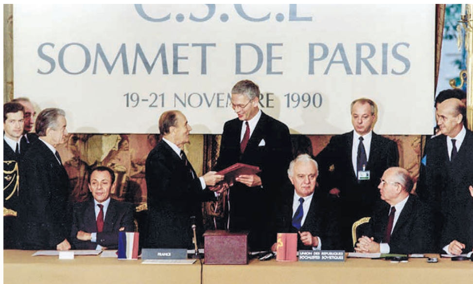
ДОВСЕ в 1990 году в Париже подписали представители 16 стран НАТО и шести стран Варшавского договора.