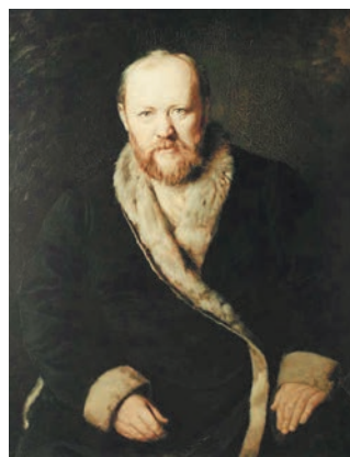
Портрет А. Н. Островского. Художник Василий Перов. 1871 год. Государственная Третьяковская галерея.

Произведения начинающего автора вызвали неоднозначную реакцию общественности. Влиятельное купечество узрело в тексте комедии «Свои люди – сочтёмся!» подрыв репутации и оскорбление сословной чести. Сочинили жалобы. Скандал дошёл до самых верхов. Император Николай I наложил резолюцию в совершенно драматическом духе: «Напрасно напечатано. Играть же – запретить». И заодно повелел установить за литератором секретный жандармский надзор. Команду «Отставить» «голубые мундиры» получили только после воцарения Александра II. С лёгкой руки августейшего инициатора реформ остро социальные пьесы «Колумба Замоскворечья» одна за другой начали появляться на сценах императорских театров.