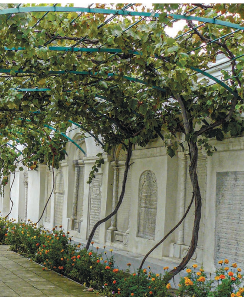
Белый мрамор, увитый виноградом, – такой увидел Островский караимскую кенасу в Евпатории.

всё поле битвы. Капитан нашего парохода ходил со мной и передавал мне подробности. Посылаю вам цветок, который сорвал на Малаховом кургане. Он вырос на развалинах башни и воспитан русской кровью».