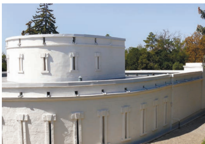
Оборонительная башня Малахова кургана и выросший на её руинах цветок воспринимались писателем как символ жизнестойкости Севастополя.

“ БЫЛ В НЕСЧАСТНОМ СЕВАСТОПОЛЕ. БЕЗ СЛЁЗ ЭТОГО ГОРОДА ВИДЕТЬ НЕЛЬЗЯ, В НЁМ НЕ ОСТАЛОСЬ КАМНЯ НА КАМНЕ. Я ОСМАТРИВАЛ БАСТИОНЫ, ТРАНШЕИ, БЫЛ НА МАЛАХОВОМ КУРГАНЕ, ВИДЕЛ ВСЁ ПОЛЕ БИТВЫ. КАПИТАН НАШЕГО ПАРОХОДА ХОДИЛ СО МНОЙ И ПЕРЕДАВАЛ МНЕ ПОДРОБНОСТИ. ПОСЫЛАЮ ВАМ ЦВЕТОК, КОТОРЫЙ СОРВАЛ НА МАЛАХОВОМ КУРГАНЕ. ОН ВЫРОС НА РАЗВАЛИНАХ БАШНИ И ВОСПИТАН РУССКОЙ КРОВЬЮ»