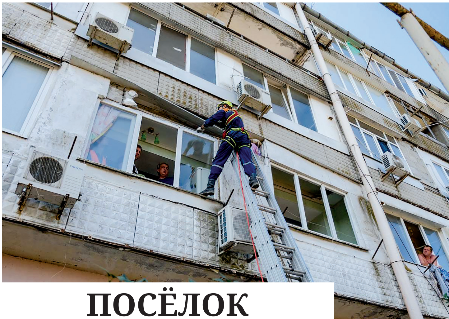
Идут восстановительные работы.

Председатель Правительства России Михаил МИШУСТИН. В конце августа стартуют продажи туров и круизов на осень в рамках очередного этапа туристического кешбэка.