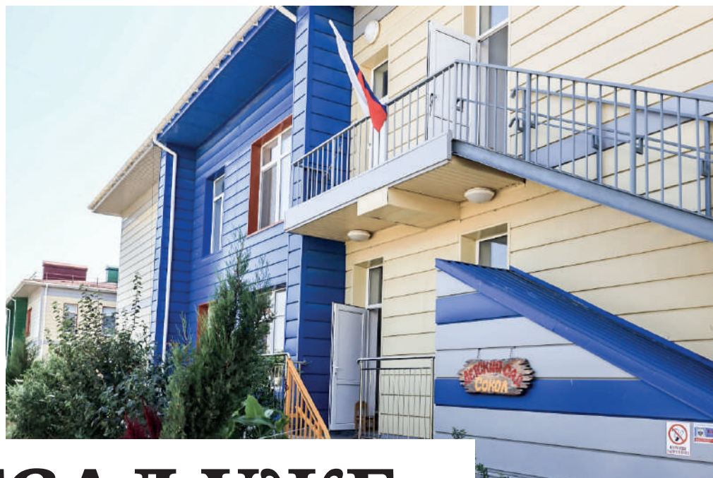
Более 300 детей посещают детский сад.

– Очень важно, чтобы не было резких перепадов между ночной и дневной температурами. При их наличии соцветие утрачивает декоративность,