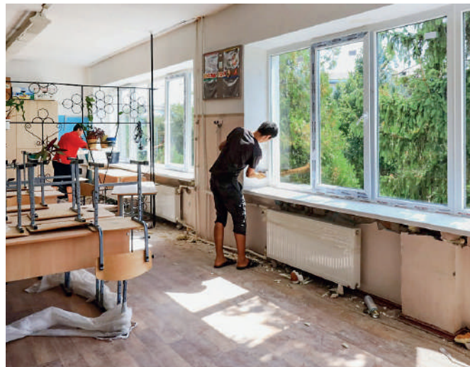
В школе завершаются косметические работы.

– Ремонтно-восстановительные работы проходят под ежедневным контролем.