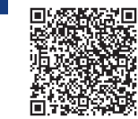
ФОТО НА САЙТЕ

– Впервые за всю историю выделены бюджетные средства для поддержки Союза пи-