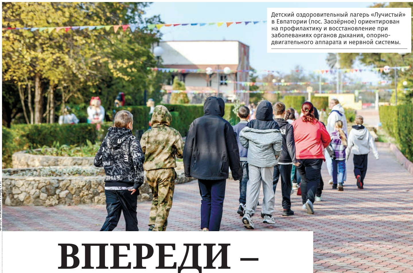
Детский оздоровительный лагерь «Лучистый» в Евпатории (пос. Заозёрное) ориентирован на профилактику и восстановление при заболеваниях органов дыхания, опорно-двигательного аппарата и нервной системы.