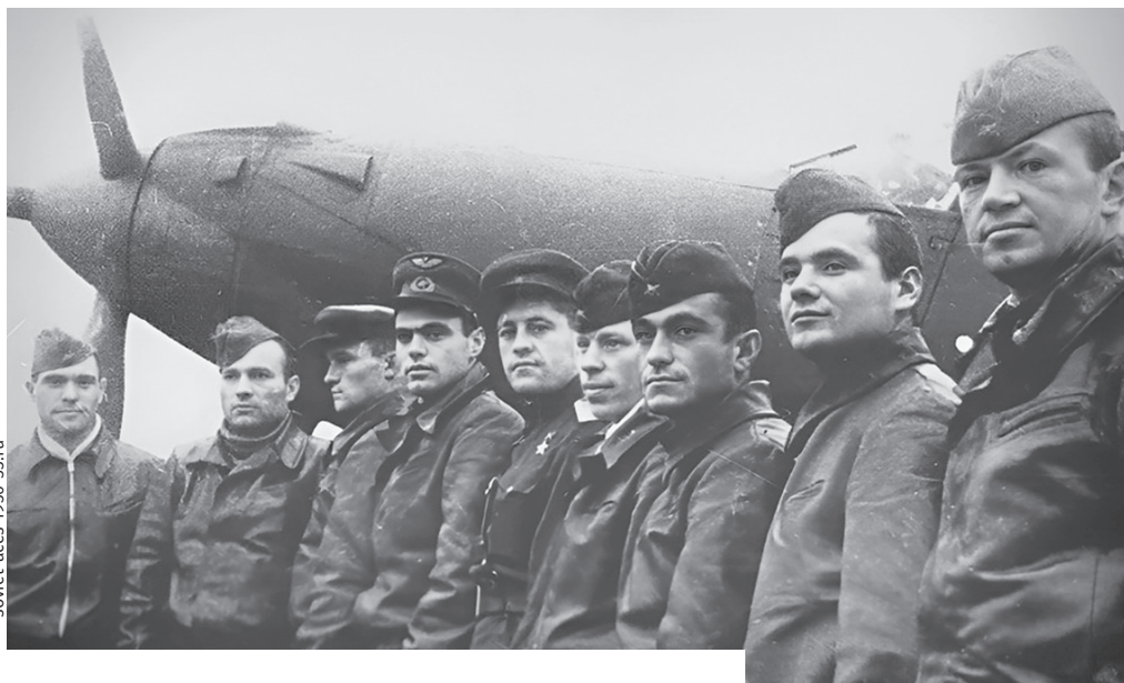
Лётчики 9-го гвардейского ИАП. Второй слева – автор книги Владимир Лавриненков, третий справа – Амет-Хан Султан.

Прославленный военачальник Маршал Советского Союза Александр Василевский в своих воспоминаниях «Дело всей жизни» отмечал, что освобождение Крыма занимает особое место в истории. На тот момент, когда были написаны его собственные мемуары,