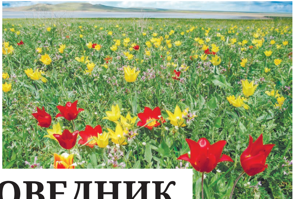
Поля диких тюльпанов по весне укрывают волшебным ковром восточный Крым.

Тюльпан Шренка похож на миниатюрный бокал для изысканного вина. Название тюльпана коктейбельского указывает на местность, где он был впервые обнаружен в 1914 году, а легенда связывает