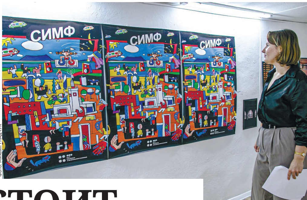
Работа Виктора Нефёдова «С.И.М.Ф.»