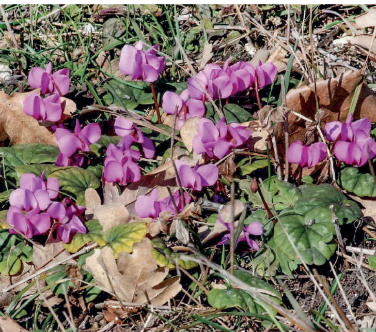
Цикламен неаполитанский – подарок Горького Крыму.

Осенью того же года департамент полиции решил «отданному под гласный надзор обвиняемому, ввиду серьёзной его болезни, переехать на жительство на Южный берег Крыма, кроме Ялты». Чехов предложил для размещения свой дом: формально он находился за пределами города, в селении Аутка. Сохранился документ, где не шибко грамотный пристав зафиксировал: «Пешков, летирактор».