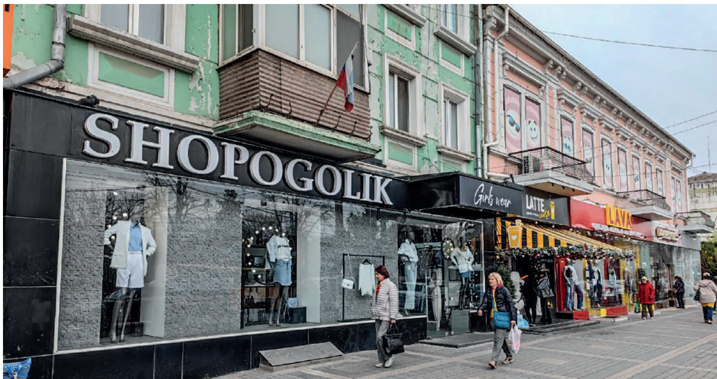
Кажется, что по улицам Симферополя ходят только англичане.

Александр ЛУКАШЕНКО, президент Республики Беларусь.