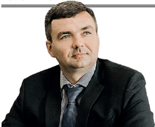
Член Общественной палаты Республики Крым, политолог Владимир УЗУНОВ.