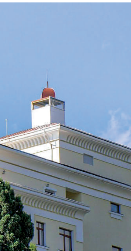
Памятник Горькому в центре Ялты, при входе в Приморский парк.