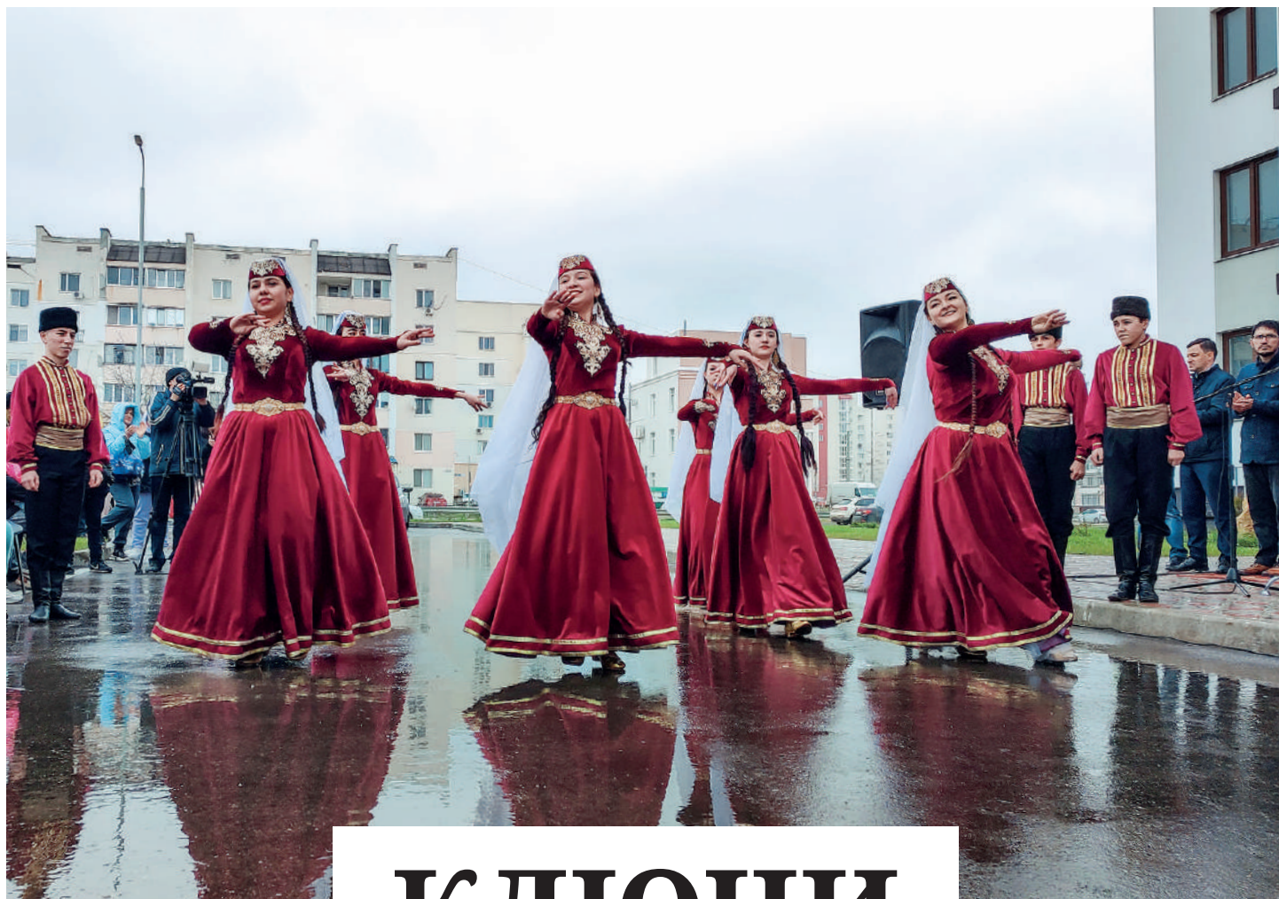
Вручение новосёлам ключей от квартир превратилось в большой праздник.

Михаил МИШУСТИН, Председатель Правительства Российской Федерации.