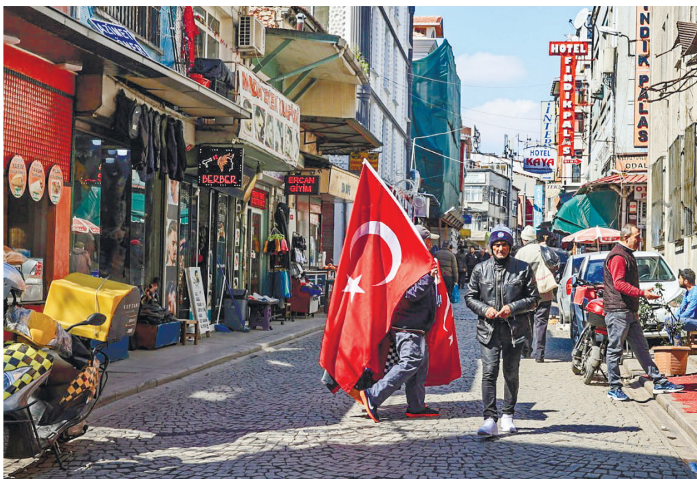
Турция ждёт второго тура выборов президента.