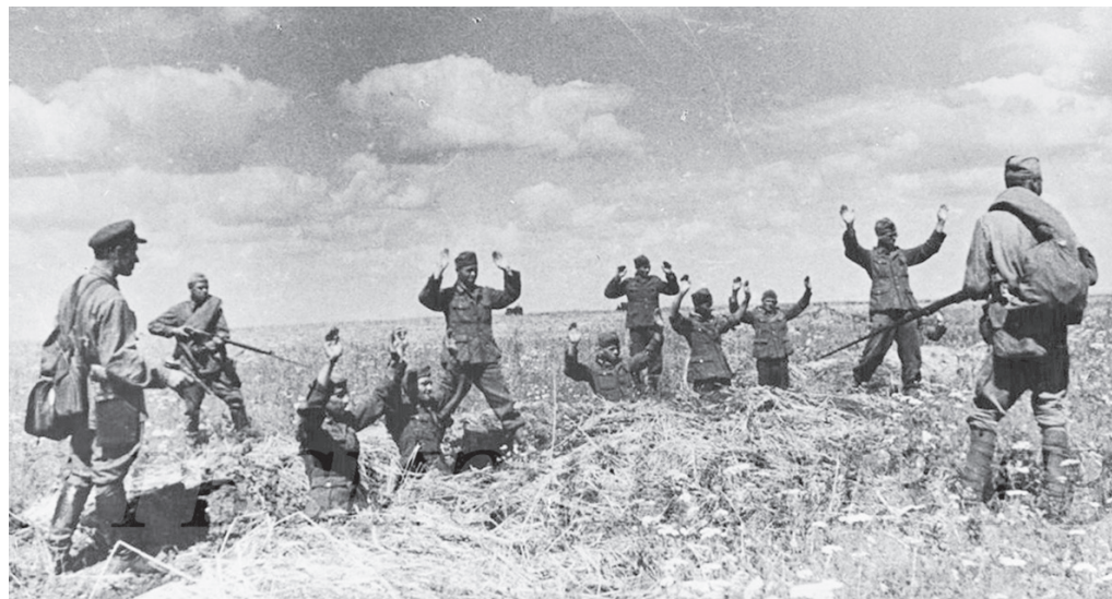
Сдача немцев в плен.

Более тяжёлая и опасная обстановка сложилась на южном фланге, где сражались войска Воронежского фронта во главе с Николаем Ватутиным. Враг смог про-