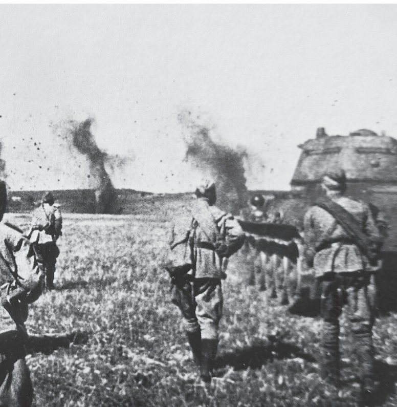
Вперёд, в контратаку!