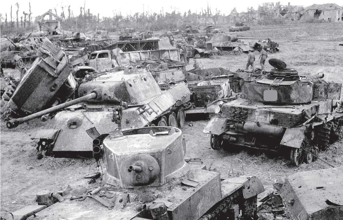
Уничтоженная немецкая бронетехника.

На момент начала сражения в войсках Центрального и Воронежского фронтов насчитывалось 1 млн. 336 тыс. солдат и офицеров, 3444 танка, 19 100 орудий и миномётов и 2172 самолёта. Кроме того, в резервном Степном фронте было около 500 тыс. бойцов, 1500 танков, 7400 орудий и миномётов и 500 самолётов.