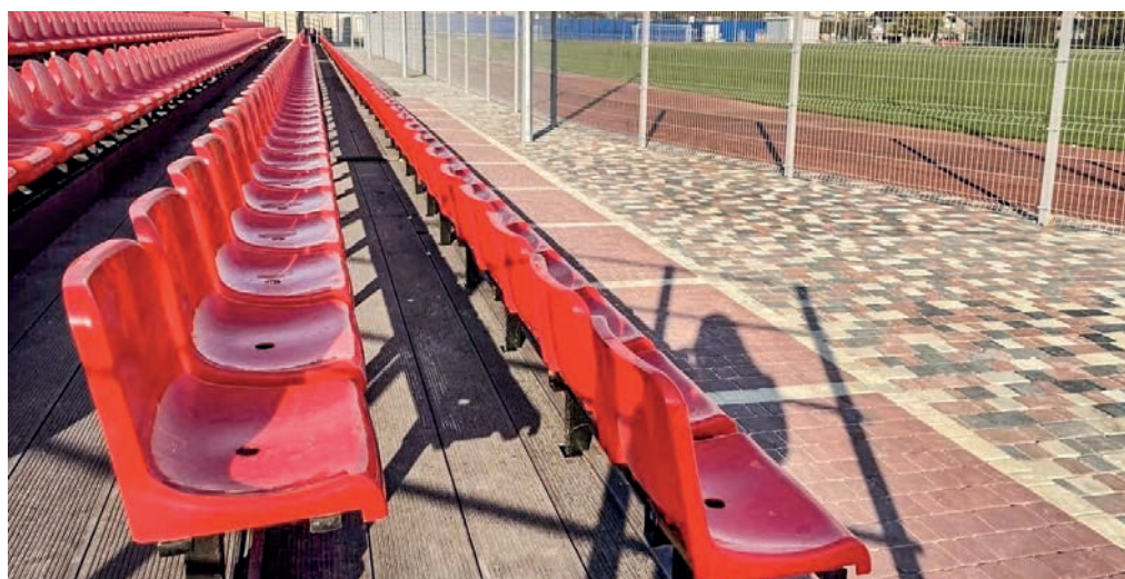
Стадион «Авангард».