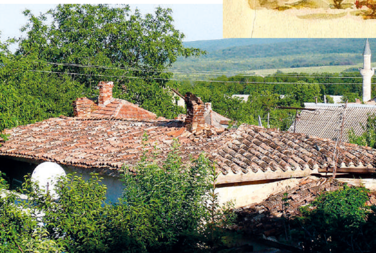
«Писательский дом» ещё сохраняет стильную крышу, но грозит скоро разрушиться.

место. Село Изюмовка возле крохотного городка Старый Крым привлекало отличным климатом, целебной водой, несуетностью бытия.