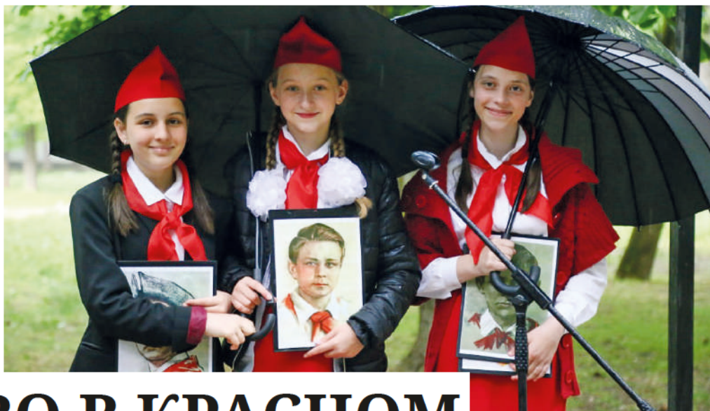
Сегодняшние дети вспоминают пионеров-героев и примеряют атрибутику организации.

Пионерия – эта детская общественно-политическая организация, она сыграла огромную роль в воспитании многих поколений нашей страны, уверен первый заме-