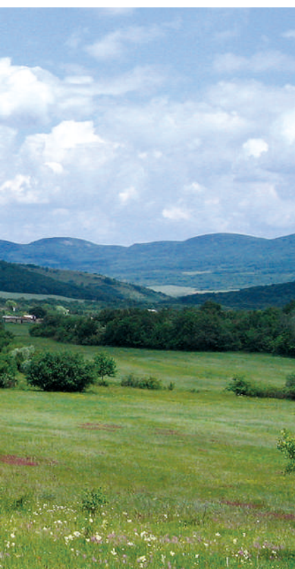
Село Изюмовка продолжает олицетворять безмятежность крымского бытия.