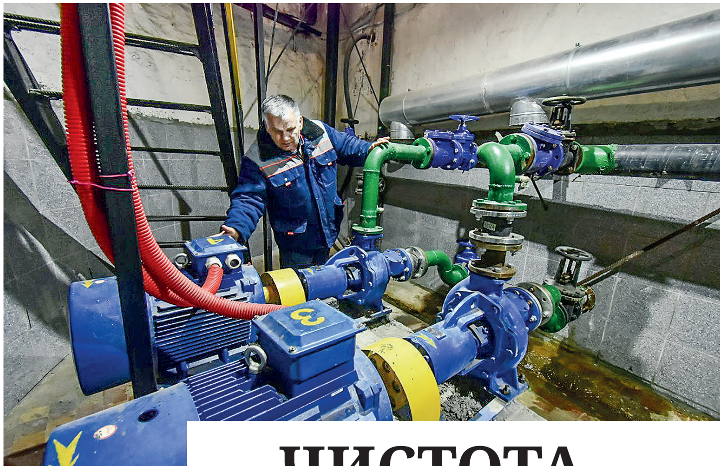
Машинист станции проверяет оборудование.

Сергей ЛАВРОВ, министр иностранных дел РФ.