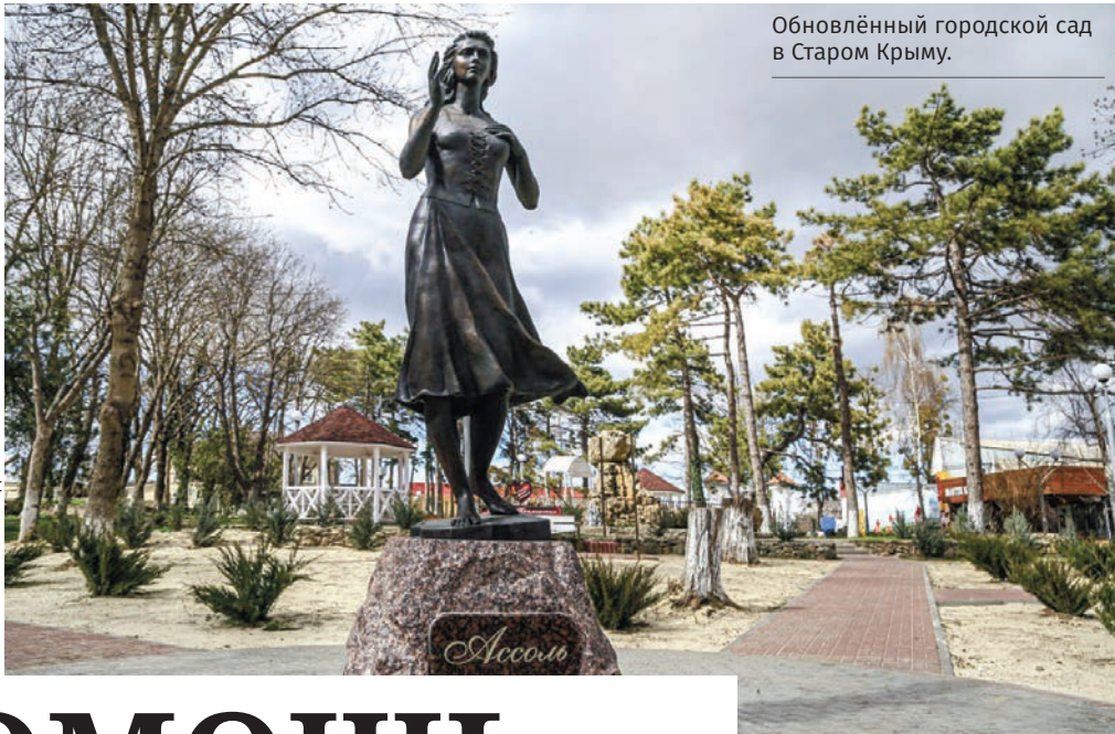
Обновлённый городской сад в Старом Крыму.